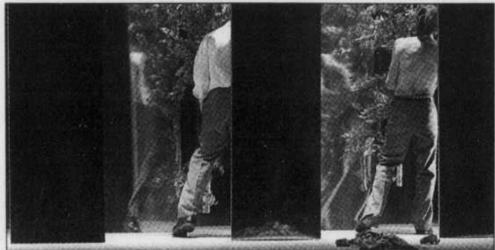
Les jeux de miroirs d' Umwelt , de Maguy Marin.

La simplicité du concept et la poésie sans fard du quotidien qui s'en dégage charment d'abord. Deux interprètes surgissent en croquant une pomme pour disparaître quelques secondes plus tard. Trois autres leur emboîtent le pas en revêtant un chandail. Et ainsi de suite: d'autres s'enlacent, boivent, s'invectivent, portent un bouquet de fleurs, se coiffent d'un chapeau, d'un casque de travail ou de guerre, et