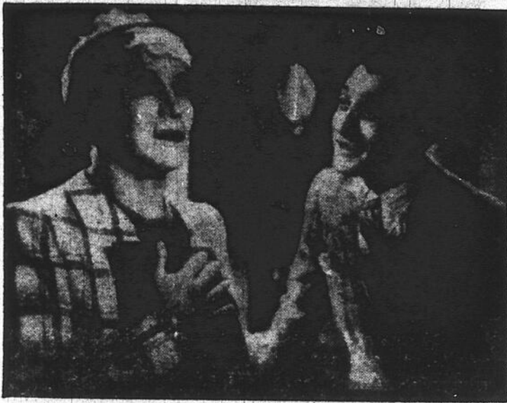
Ces scènes du film "Une Femme Disparaît" que le cinéma Orpéum offre cette semaine en grande première à ses habitués. Françoise Rosay, Henry Guisol y sont mis en vedette et secondés par une distribution toute d'étoiles.