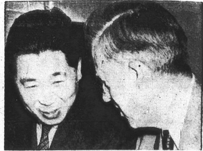
Le vice-président des Etats-Unis, Henry-A. Wallace, à droite, discute de son prochain voyage en Chine avec le Dr Wei Tao-Ming, ambassadeur chinois aux Etats-Unis.