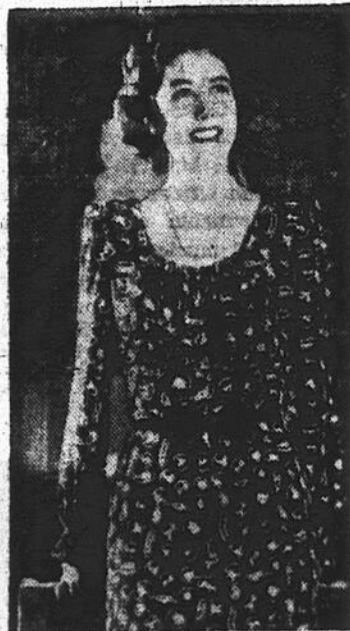
Toute jeune mariée veut avoir dans son trousseau une robe imprimée cette année et celle que porte ici Elisabeth Reller artiste CBS et qui est brune et blanche est parmi les plus folles. Elle peut se porter indifféremment avec des accessoires blancs ou bruns. Les manches sont généreuses et l'incolore portrait fort jolie.