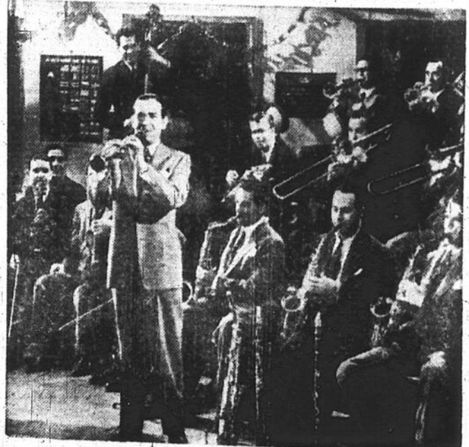
Johnny Dorsey et son orchestre dans le film musical "Four Jills and a Jeep" qui prend l'affiche aujourd'hui au cinéma Capitol.