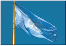
Le drapeau de l'ONU, par Makaristos Wikimedia Commons

Au-delà, il n'est pas inutile de rappeler ce que l'on croit être une évidence. L'analyse d'une situation dépend largement du point de vue de son observateur. Contrairement aux croyances généralement partagées, les représentations incomplètes de la réalité, les déformations et autres manipulations sont l'ordinaire et non l'exception. Le droit se doit de considérer et d'anticiper ces comportements pour une gestion satisfaisante d'une crise.