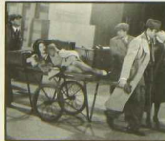
La Bonne Fortune