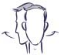
1. ROTATION DE LA TÊTE