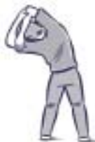
8. MUSCLES LATÉRAUX DU CORPS