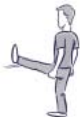
7. ARRIÈRE DE LA JAMBE (ISCHIO JAMBIERS)