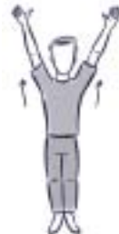
3. ÉLEVATION SUR LA POINTE DES PIEDS