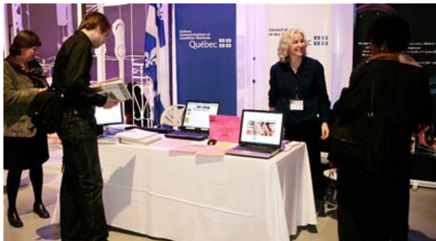
Des représentants du CALQ, du MCCCFC et de la SODEC ont répondu aux questions des participants du Rendez-vous novembre 2007 - Montréal métropole culturelle qui se sont arrêtés à leur kiosque.

Serez-vous le prochain boursier à faire un séjour en résidence au studio du Québec à Berlin ?