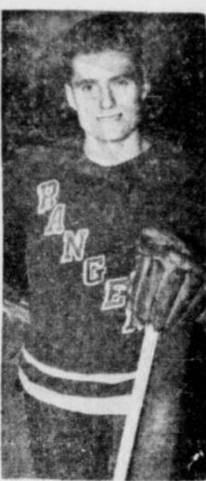
Avec Rangers — Allan STANLEY est ici photographié dans son nouvel uniforme des Rangers de New-York.

Les Indiens l'emportent sur les joueurs d'Ontario en exhibition KITCHENER, 15 (P.C.) — Le jeu de badminton indien pour la seule Thomas a défilé les joueurs de l'Ouest de l'Ontario dans une série de quatre matches d'exhibition au club Granite de Kitchener, samedi dernier.