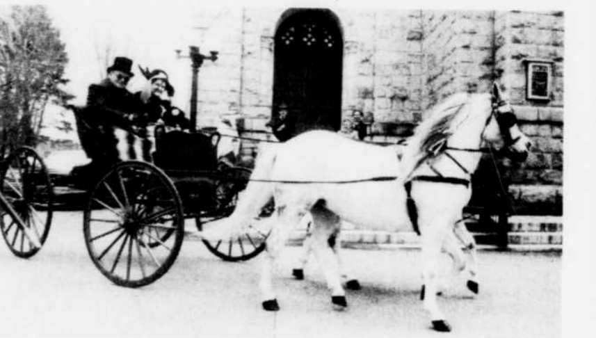
Mme Raymonde Dostie a effectué le transport vers l'église Saint-Jean-Baptiste en carriole.

présentée à Mme Dostie pour lui rappeler cette célébration quelque peu spéciale.