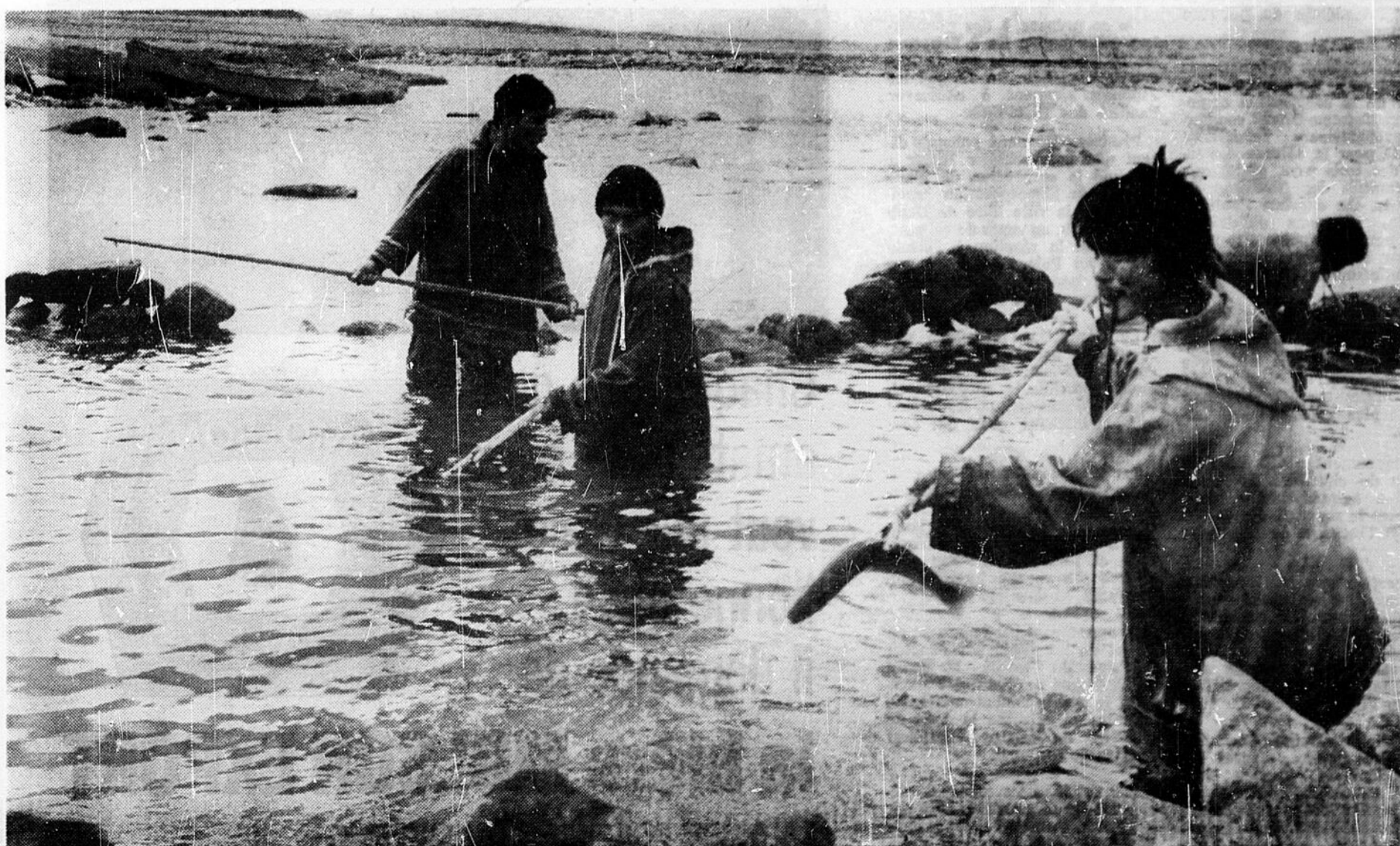
La saison de l'omble est courte, environ un mois. C'est pourquoi au temps de la montée des poissons, tout le monde travaille à une allure folle. Ce poisson délicat, à la chair rose tendre, s'apprête à peu près comme le saumon.