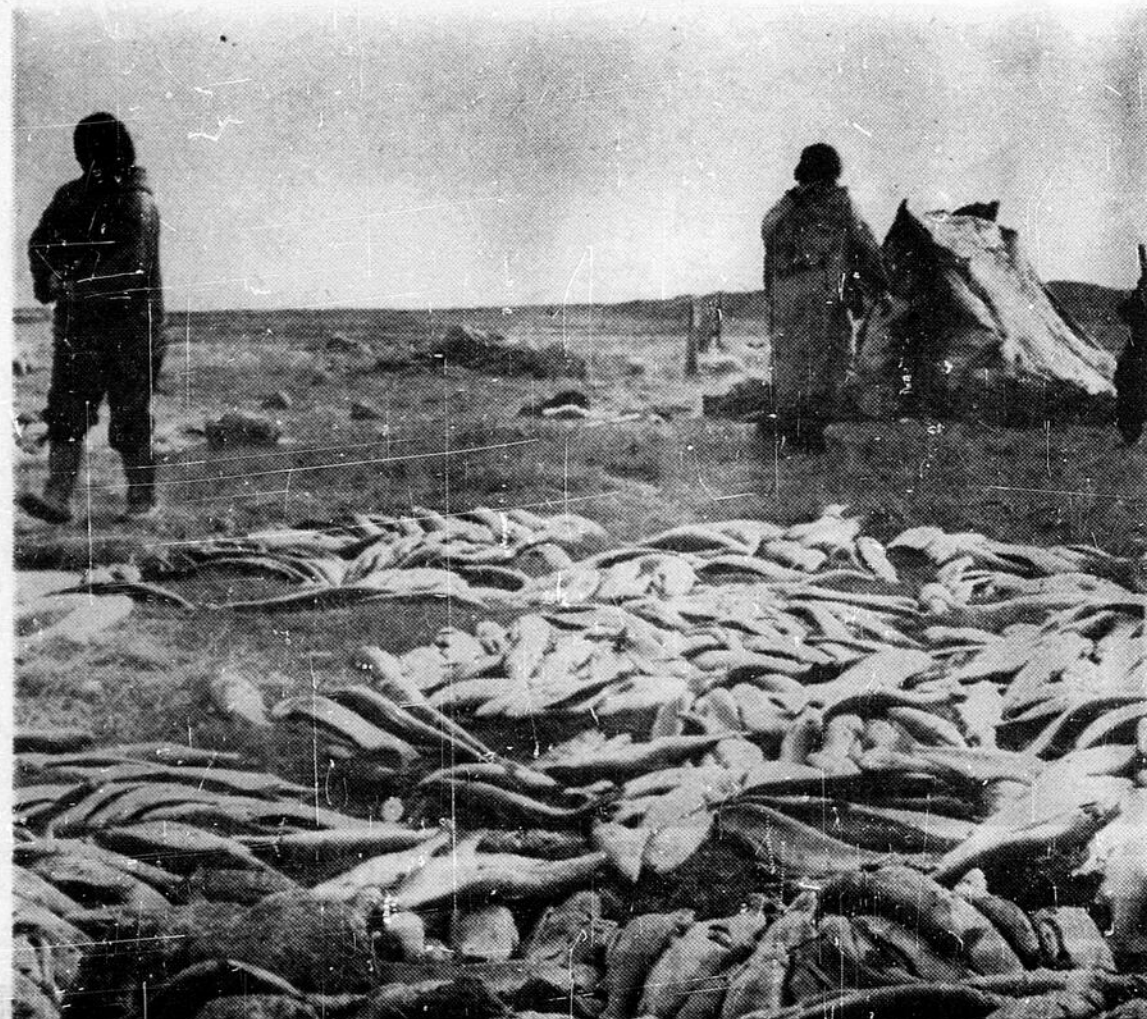
Le principal marché de l'omble arctique au cours des dernières années se trouvait dans l'est du Canada. En 1961, l'exportation commença vers les E.-U. et outre-mer.

Si l'on peut trouver le moyen de généraliser les petites opérations de pêche sur une grande partie du Grand Nord, il semble que l'avenir de l'omble arctique soit prometteur. On sait que ce poisson du Nord est rapidement devenu un grand favori sur les menus des grands hôtels et des restaurants réputés, tant au Canada, aux Etats-Unis que sur les tables européennes.