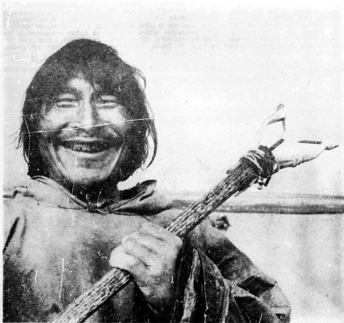
C'est avec cet instrument à hameçons bien particuliers que l'Esquimau pêche l'omble arctique, un mets choisi qui fut servi sur les tables des grands dîners d'Etat.