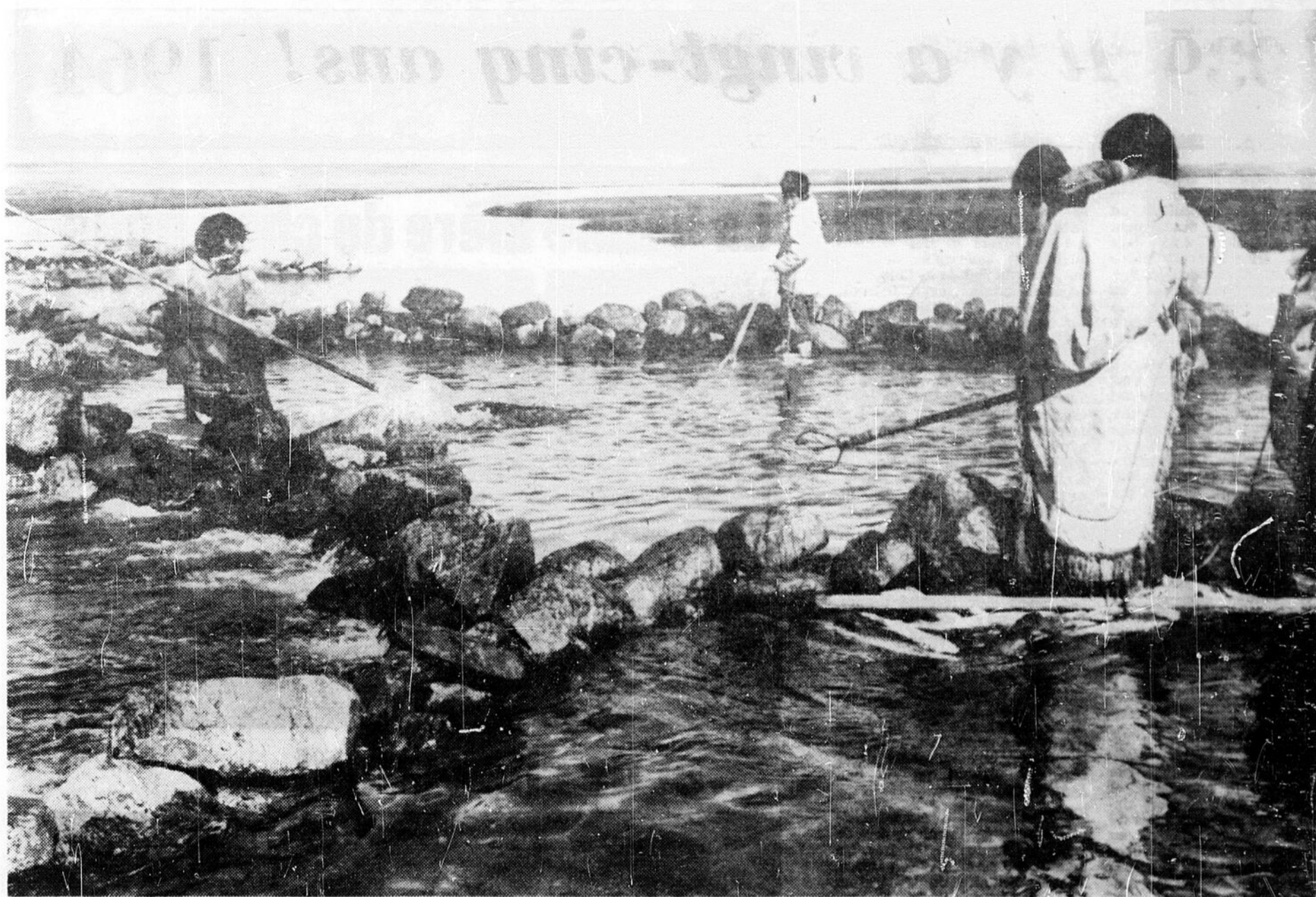
Même la maman esquimaude, avec son bébé retenu au dos, prête son concours à la prise de l'omble arctique. La saison est courte et rapporte beaucoup. Il faut donc faire vite.