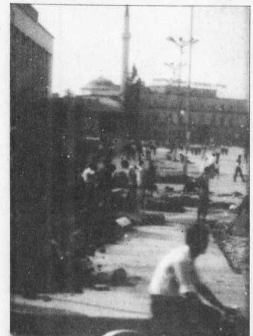
Au coeur de la capitale, sur la place Skanderberg, les automobiles sont rares.