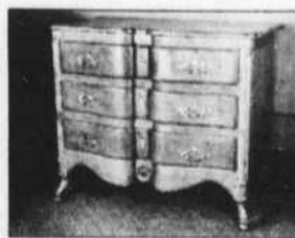
Commode armoire canadienne XVIIIe siècle