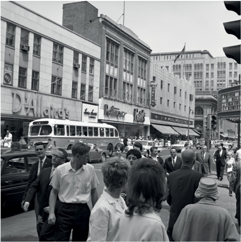
Rue Sainte-Catherine en direction est, près de l'Avenue McGill College, en 1968, photo Yvon Bellemare, Archives de la Ville de Montréal, VM94-A0027-010

L'autre échelle significative est celle du quartier ou de la municipalité de banlieue 64 . À tout seigneur tout honneur, le Vieux-Montréal fait l'objet de livres et d'un site internet 65 . Plusieurs autres quartiers montréalais ont eu droit à des expositions et, parfois, à des publications 66 . Les sociétés historiques locales participent aussi au mouvement.