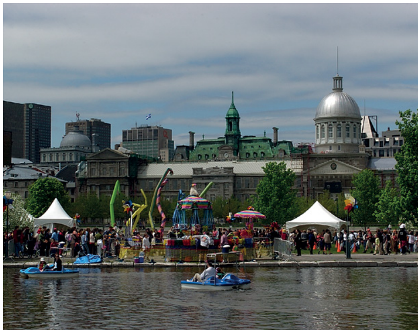
La façade fluviale du Vieux-Montréal en 2004

Une cinquième caractéristique de Montréal peut aussi expliquer l'intérêt que lui portent les chercheurs et la population. Il s'agit de sa dimension patrimoniale qui en fait un véritable musée à ciel ouvert. Le Vieux-Montréal, le Vieux-Lachine, le village du Sault-au-Récollet, le Mille carré doré, l'ensemble urbanistique de Maisonneuve, les maisons ouvrières du Sud-Ouest ou du Plateau, le réceptacle migratoire du boulevard Saint-Laurent et la Petite-Italie, la rue Sainte-Catherine, Place Ville Marie et le nouveau centre-ville; tous ces lieux et bien d'autres en fournissent de remarquables exemples. Plus de trois siècles d'une histoire riche et multiple se déploient sous nos yeux.