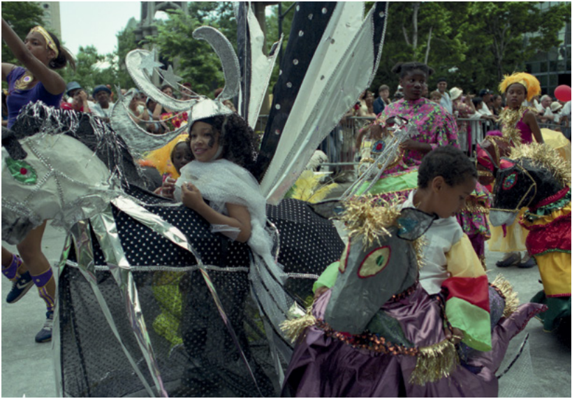
La Carifète en l'an 2000

deux villes et cela se poursuit au 19 e siècle. Au fil des décennies, Montréal supplante Québec et devient la grande métropole. La ville profite d'un réservoir démographique, la plaine de Montréal, qui abrite au moins la moitié de la population du Québec. Elle y déploie très tôt ses tentacules. La taille de Montréal et sa composition ethnoculturelle moins nettement canadienne-française que le reste du Québec, lui confèrent toutefois un statut particulier qui, aux yeux de certains, la rend moins québécoise. D'ailleurs, dans les années 1950 et 1960, certains intellectuels francophones ne lui accordent que peu de place dans leur interprétation de l'histoire du Québec aux 19 e et 20 e siècles.