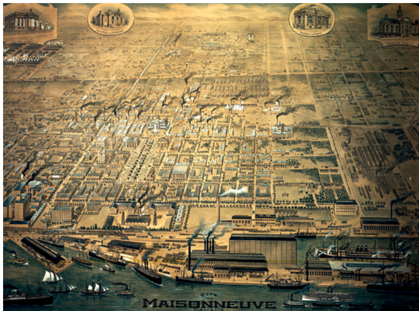
Plan de Maisonneuve (avant 1918), Archives de la Ville de Montréal, VM94-D0098.

Tout en évoquant son parcours personnel, l'auteur retrace l'émergence de l'histoire urbaine en tant que champ spécifique au sein de la discipline historique. Il aborde le bilan des réalisations de cette spécialité au Québec et au Canada, en mettant en exergue la place centrale, et même dominante, qu'y occupe l'histoire de Montréal. Celle-ci exerce une fascination indéniable autant auprès des historiens et des historiennes que du grand public. L'auteur tente de caractériser l'apport de la recherche historique à la compréhension du destin de la métropole. Il se demande aussi comment cette histoire urbaine peut aider à saisir les enjeux qui se posent dans la ville d'aujourd'hui.