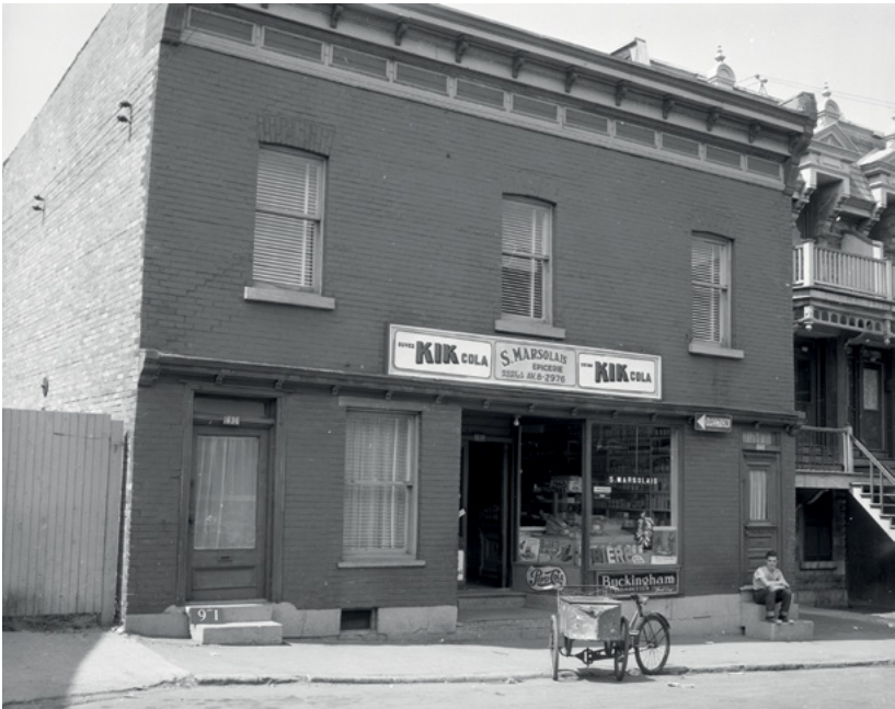
Une épicerie de quartier au 1638 rue Sanguinet, 1957.

Histoire sociale et histoire urbaine ont ainsi des affinités indéniables, mais d'autres paradigmes gagnent en importance dans les décennies suivantes, notamment la culture, le genre, la marginalité, l'environnement, etc. J'y reviendrai.