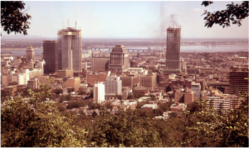
Le nouveau centre-ville en expansion vers 1961