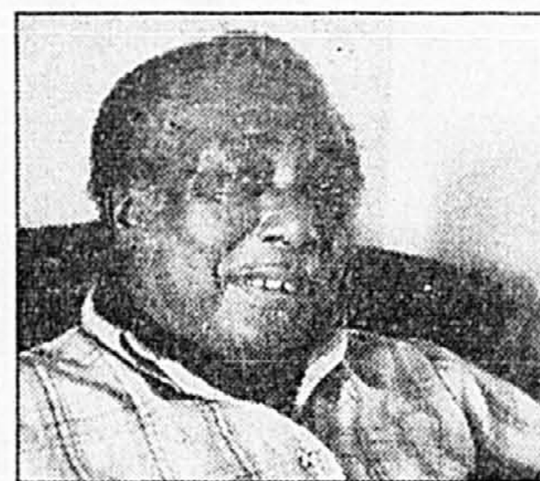
R. L. Burnside Un peu de blues, un peu de chance