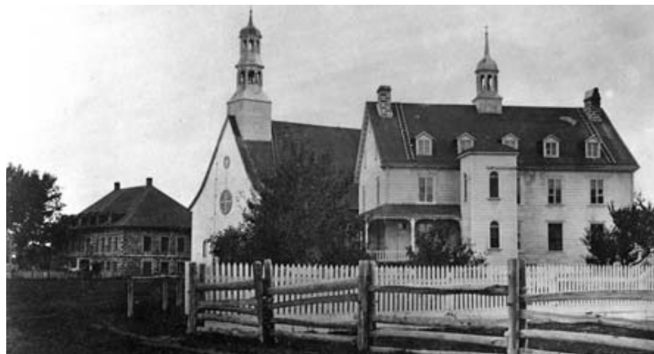
Le noyau villageois de Rivière-Ouelle vers 1870.

Construit en pierre, ce presbytère était