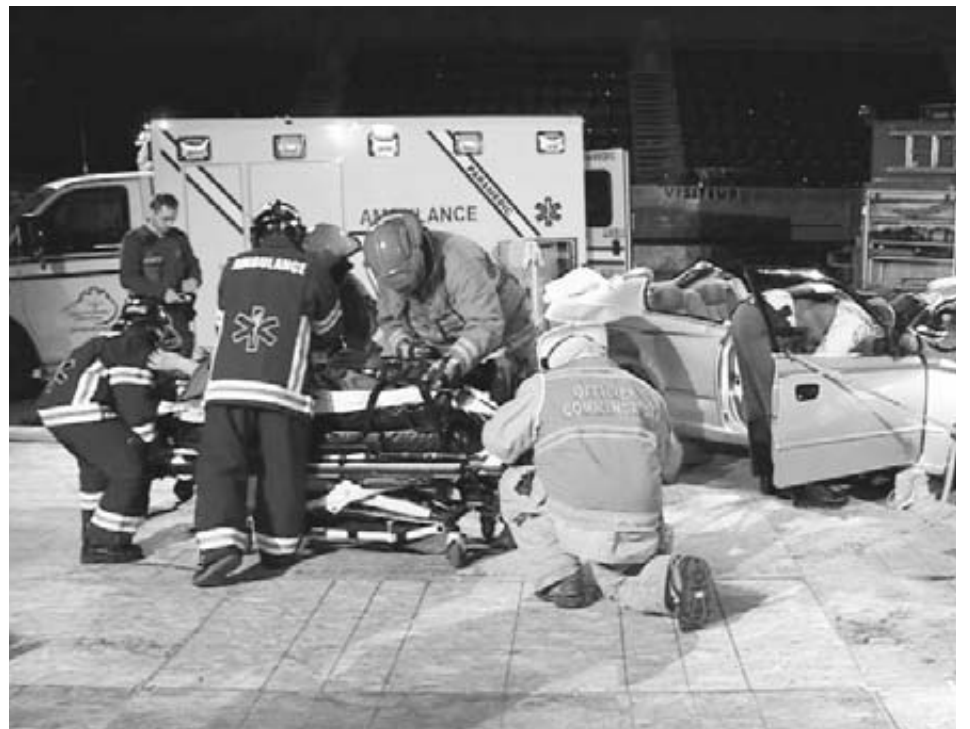
Mise en scène du projet IMPACT

Tenu aux deux ans, le projet IMPACT vise, grâce à une simulation réaliste, à conscientiser les jeunes de 4e et 5e secondaire aux dangers de la vitesse, des messages textes au volant et de la conduite avec les facultés affaiblies par l'alcool et la drogue. Outre la Sûreté du Québec, les municipalités, la SAAQ et de nombreux commanditaires assurent la réussite de ce projet.