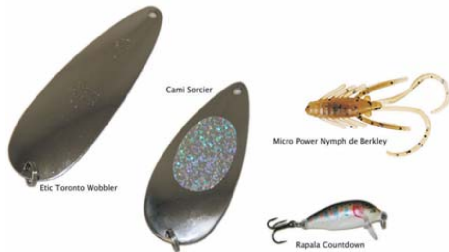
Exemple de leurres.