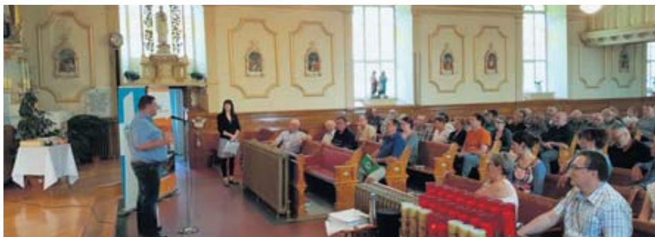
Près de 80 personnes étaient réunies à l'église de Saint-Philippe-de-Néri pour parler de l'avenir des églises (photo courtoisie).