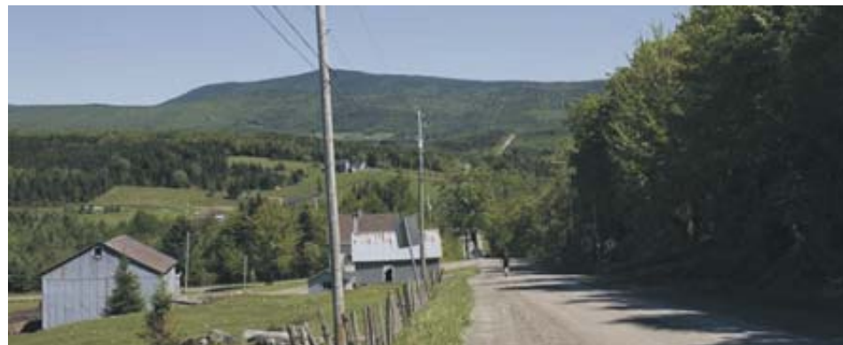
Le changement de tracé apporté au Chemin de Saint-Rémi n'a pas fait l'unanimité.