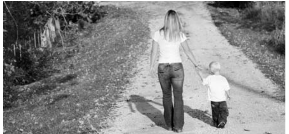
Visages régionaux a fait paraître les résultats d'un sondage sur la migration des jeunes en région.