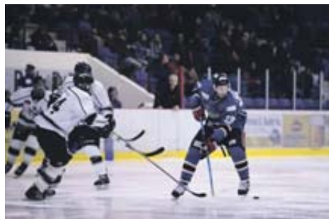
Les Seigneurs de La Pocatière seront de retour la saison prochaine dans la LHCS – Le Placoteux.