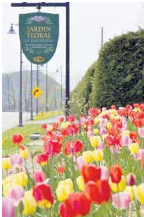
Du nouveau au Jardin floral.

Pour la phase 2 en 2017, les escaliers et belvédères sont dans la mire du Jardin floral ainsi que des projets de jardins thématiques à être dévoilés. Un partenariat avec Incroyables comestibles a aussi été mis en place récemment. La deuxième phase coûtera environ 30 000 $ également. Avec son Fonds de développement des territoires, la MRC de Kamouraska s'engage pour un montant de 8000 $.