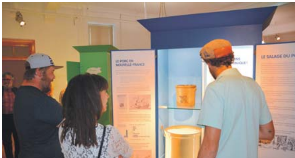
Les gens présents à l'inauguration ont consulté en grande primeur le contenu de l'exposition.

Outre l'exposition Le porc s'expose : 400 ans de présence au Québec, trois autres expositions sont à venir Musée québécois de l'agriculture et de l'alimentation. L'horaire peut être consulté sur le site internet www.mqaa.ca .