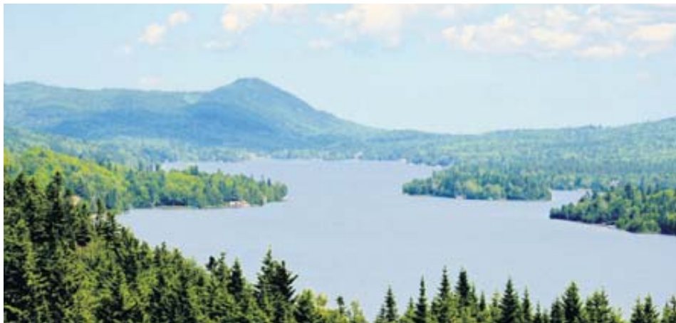
Vue sur le lac Trois-Saumons à partir du belvédère.

Publiée le 25 février 2016 sur Narcity Montréal, cette liste a refait surface récemment après avoir été partagée par la Municipalité de Saint-Aubert, sur sa page Facebook, visiblement fière de cette reconnaissance.