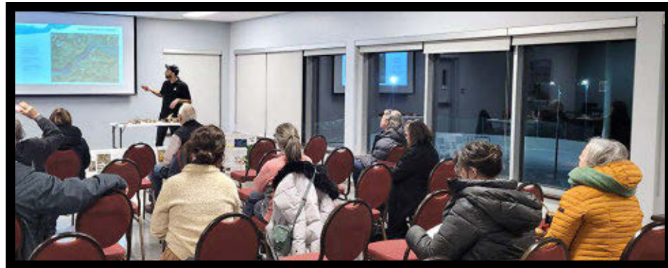
Une rencontre d'information a permis aux riverains d'avoir un aperçu des constats du projet.

Les différents inventaires qui ont été réalisés pendant la durée du projet ont permis d'identifier un peu plus de 200 espèces