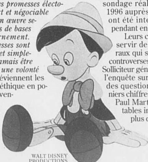
WALT DISNEY PRODUCTIONS