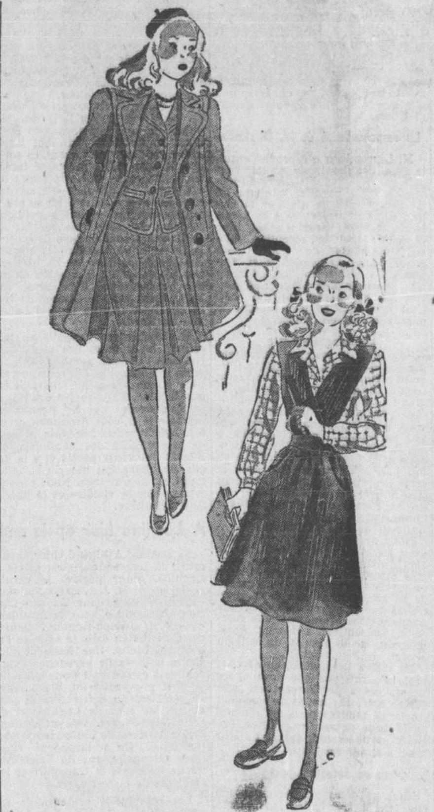
Il n'est certes pas trop tôt pour prévoir et organiser la garde-robe des fillettes qui retourneront à la classe en septembre. Voici deux ensembles des plus pratiques. Il n'est pas indispensable, bien entendu, que le "jumper" soit de corduroy, tel qu'on le voit sur la vignette.

guide en tout. Les animaux sont nos meilleurs amis. L'enfant doit l'apprendre jeune. Si l'on veut détruire en lui son instinct de cruauté envers les animaux, apprenons-lui à ne pas détruire les nids d'oiseaux, les oeufs d'ouï sortis l'oisillon. Car les oiseaux se nourrissent des insectes, ces ennemis de nos cultures. Nous en ferons ainsi peu à peu un protecteur, un défenseur des êtres utiles dans la création.