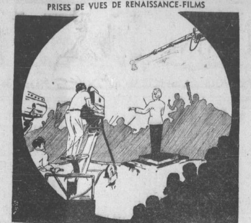
Voici une saisissante caricature qui nous transporte par anticipation au Chalet de Mont-Royal, en merinée, le 6 août prochain, lors que les tournages de "Renaissance-Films" donneront les premiers tours de manivelle du "Père Chopin" à l'occasion d'un grand concert au bénéfice des "Amis de l'Art". Producteurs, tourneurs, tourelle mécanique, réflecteurs puissants, tout contribue à créer l'ambiance propre aux studios de production.

M. Boyer répond alors aux trois arguments invoqués en 1939 par les libéraux contre l'Union nationale, à savoir que l'administration Duplessis avait déclaré des élections en temps de guerre, se rendant ainsi coupable de sabotage na-