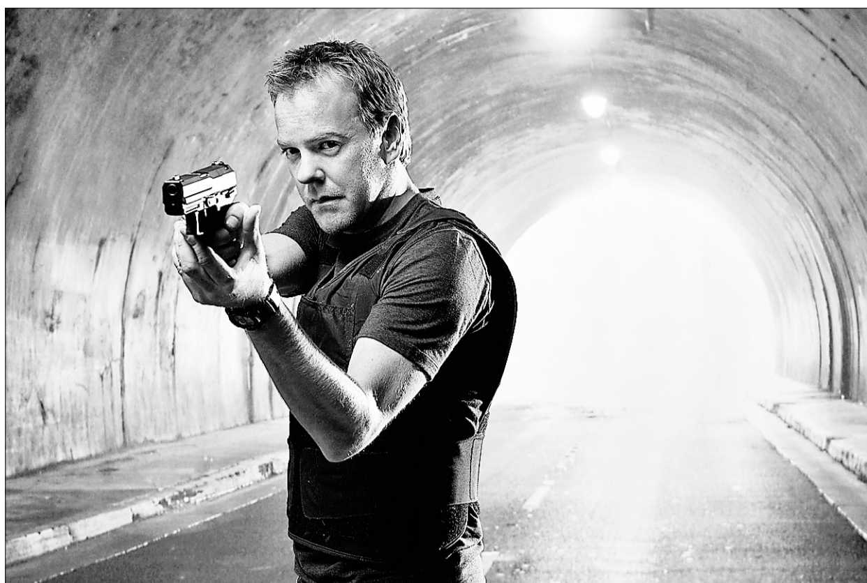
Jack Bauer (Kiefer Sutherland) de 24 heures chrono hurle dans son cellulaire dans un français international sur les ondes de Télé-Québec, mais uniquement in English dans son boîtier DVD québécois.