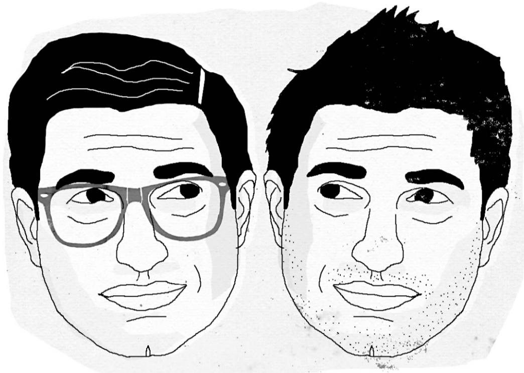
ILLUSTRATION FRANCIS LÉVEILLÉE. LA PRESSE

P.M.: C'est un manque qui n'est pas dû exclusivement au départ de Marie-France. C'est sûr que le