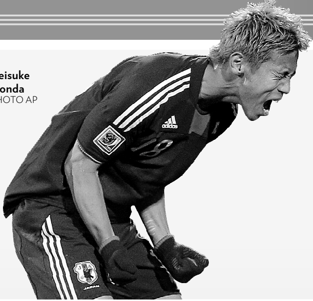
Keisuke Honda