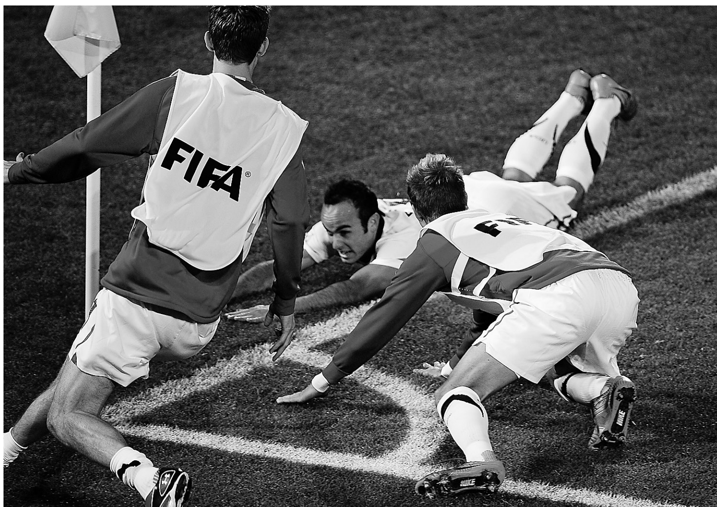
Des réservistes de l'équipe américaine sont allés retrouver le festif Landon Donovan, qui a marqué le seul but de la rencontre, dans les arrêts de jeu, mercredi. Les Américains ont ainsi terminé en tête du groupe C et ils affronteront les Ghanéens en ronde huitième de finale.