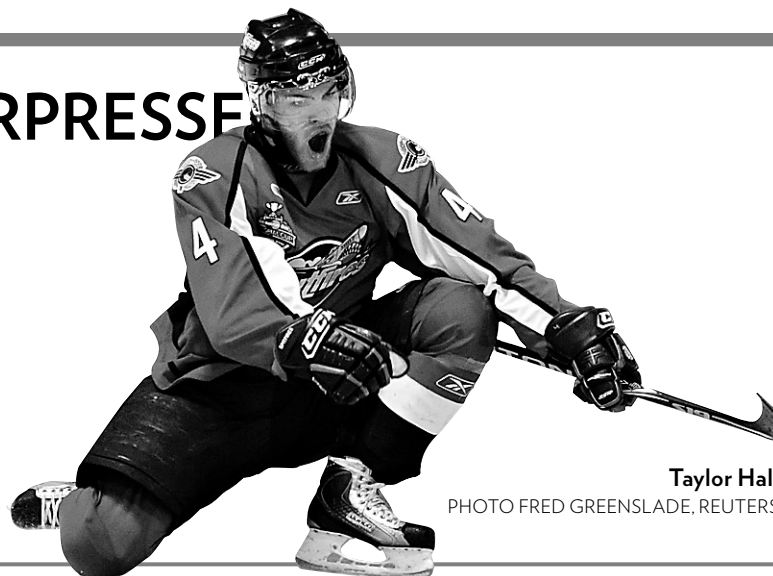
Taylor Hall