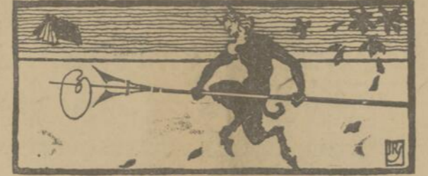
L'HOMME DU JOUR