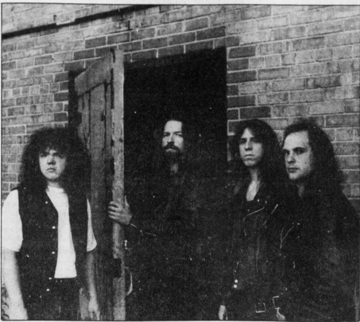
Hanker est un groupe de la Côte-de-Beaupré qui, depuis sa fondation il y a neuf ans, tente de démontrer que le «heavy» est toujours vivant.

« Le «heavy» n'est pas mort. C'est certain qu'on en parle moins que dans les années 80, lorsqu'il y a eu la grosse vague de groupes de Californie. Après, c'est devenu trop bonbon et les gens se sont désintéressés. Mais il y a encore un public pour ce style. On en entend simplement moins parler. Ça marche toujours. MuchMusic, par exemple, n'a pas la même orientation que MusiquePlus. L'émission Power Thirty de Much est axée sur le «heavy» alors que le «SolidRok» est plus portée vers le «grunge». Je pense qu'il va y avoir un regain d'intérêt dans les années