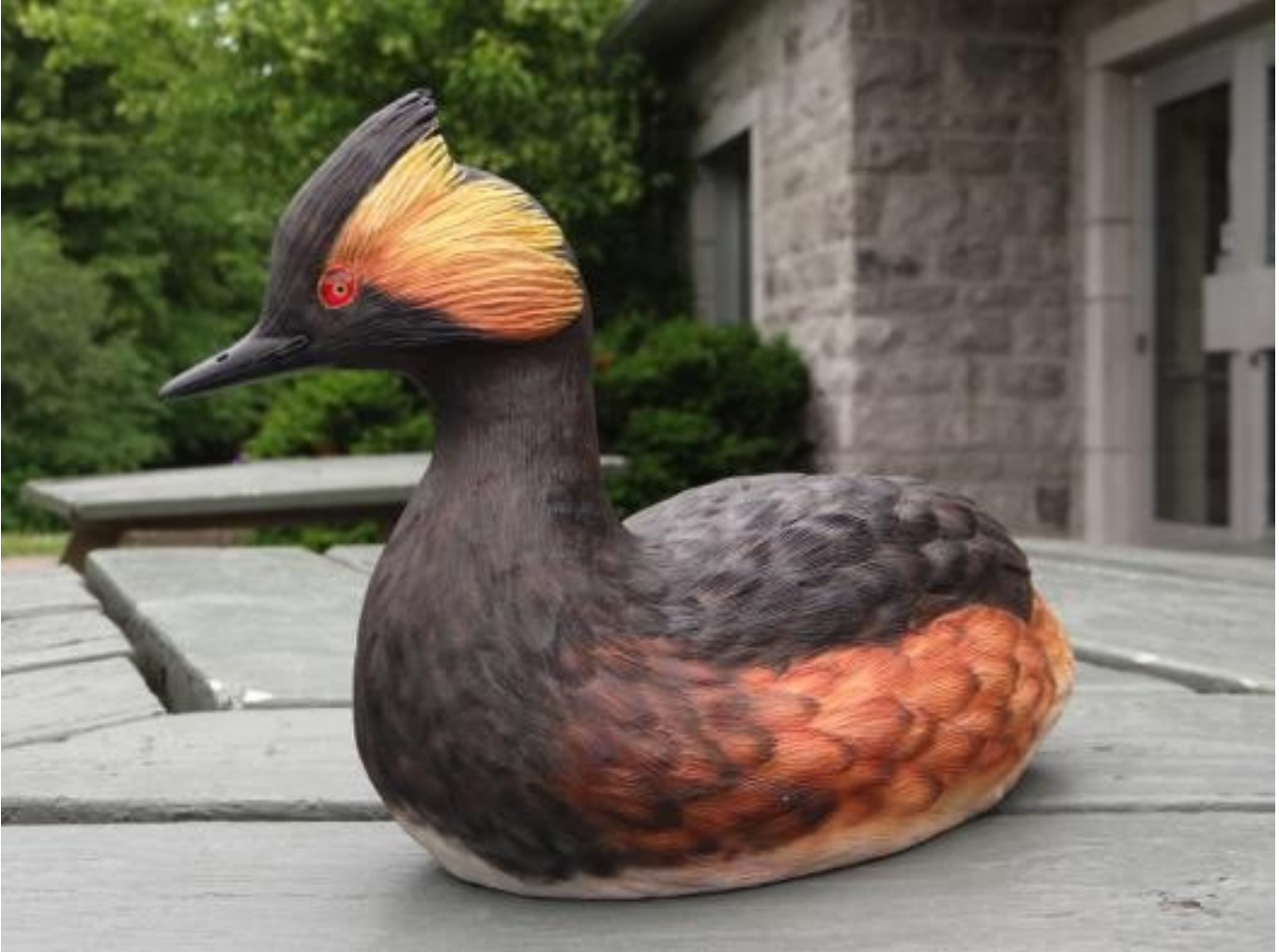
Grèbe à cou noir