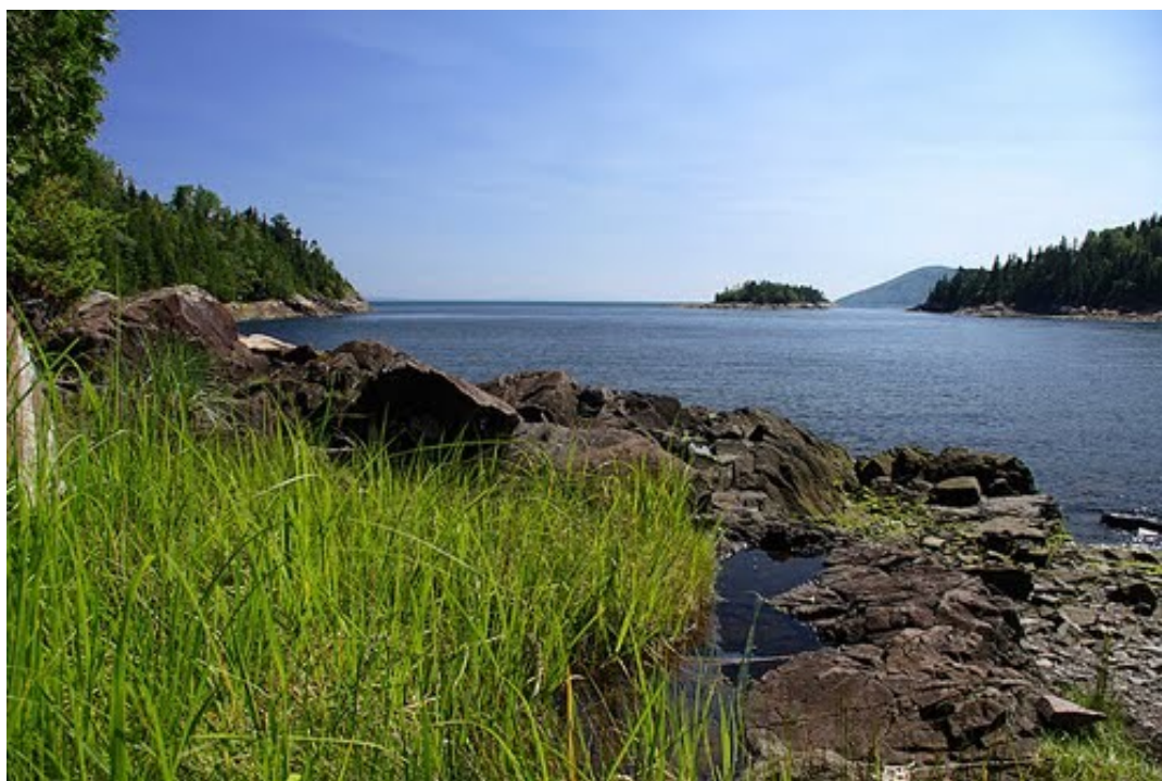
Baie de Port-aux-Saumons