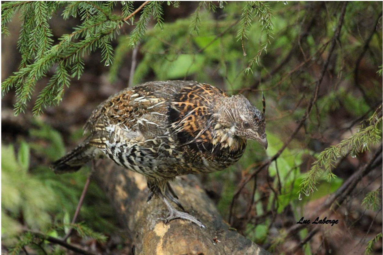
Gélinotte huppée à Port-au-Saumon