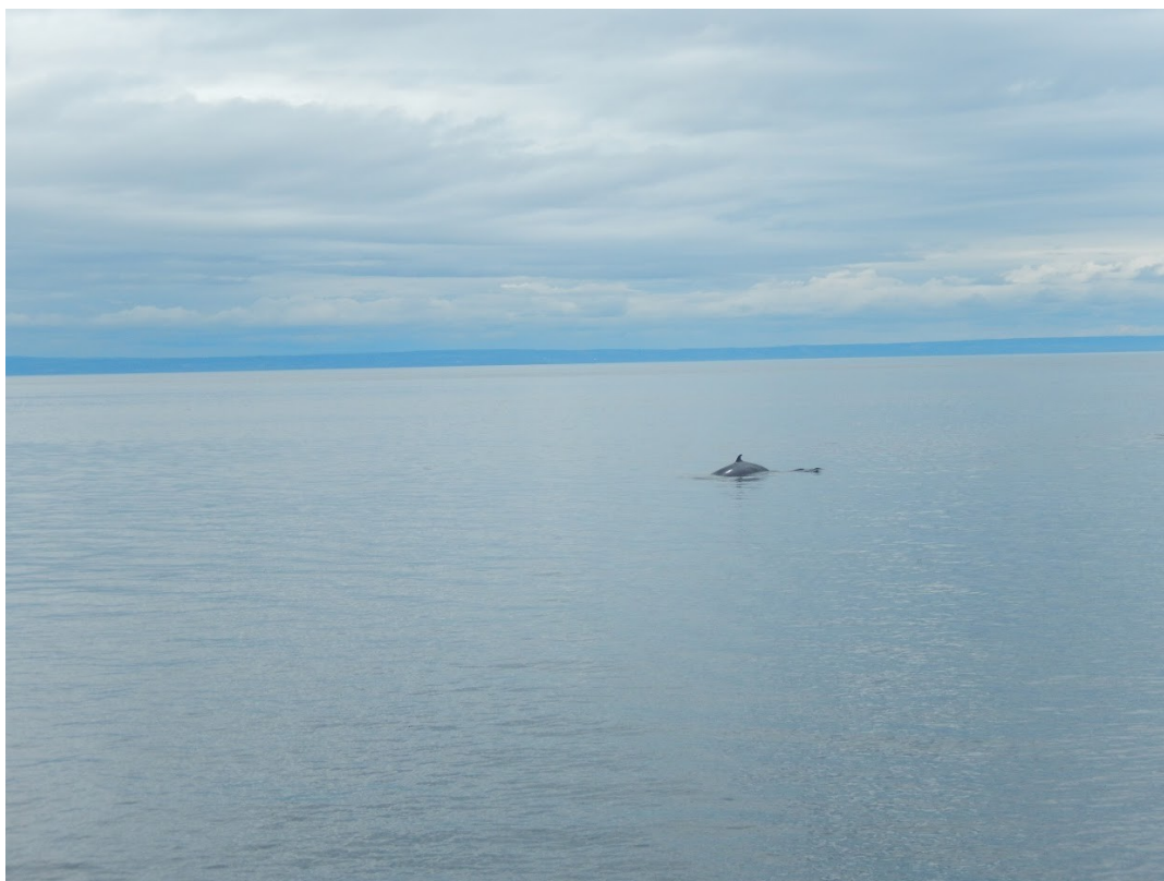
Petit rorqual à Cap Bon Désir ( juin 2017)