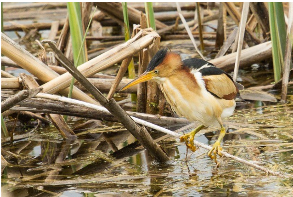
Petit Blongios par Louise Auclair

Nous étions tout près de 35 participants motivés à sortir nos télescopes et nos jumelles. Tout a bien commencé pour certains qui se sont dirigés vers le marais Léon-Provencher de Neuville. En effet, un Petit Blongios était visible sans que notre vue ne soit obstruée par les tiges des quenouilles si hautes à ce moment de l'année.