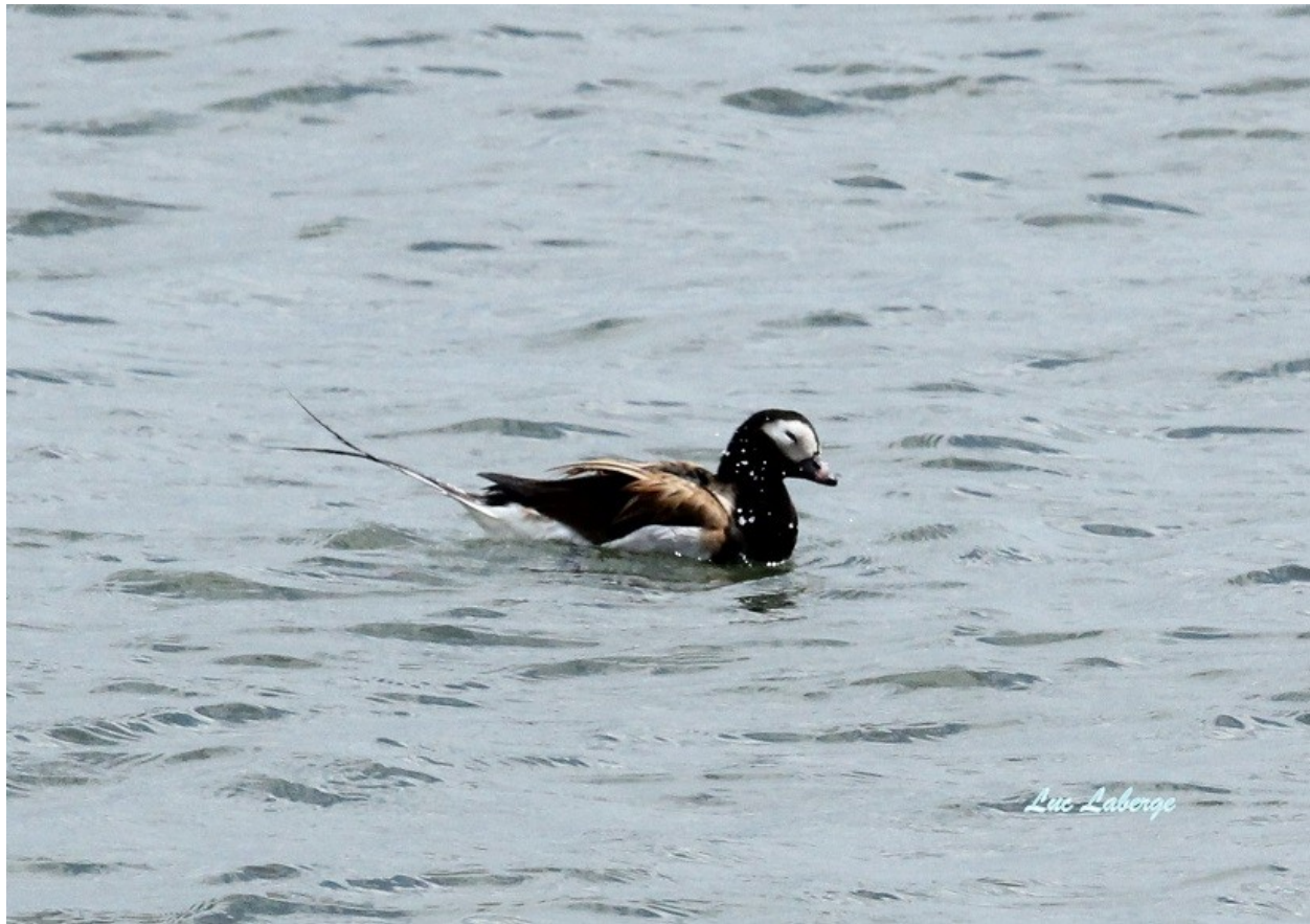
Harelda kakawi à St-Siméon