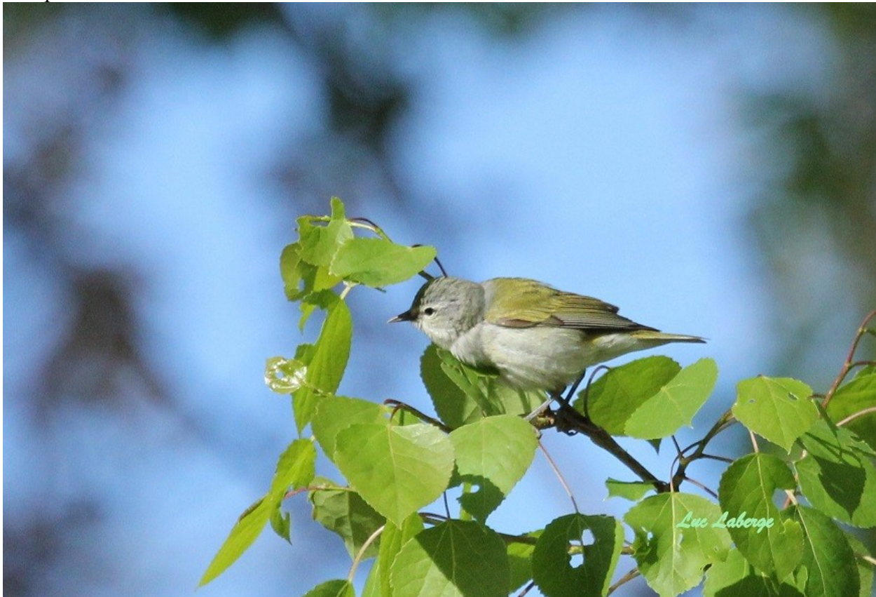
Paruline obscure à Port-au-Saumon

Une fois arrivés sur place, nous prenons possession de nos logements qui ressemblent à de petites maisonnettes. Alain, Gilles et moi en partageons une. Les réveils sont hâtifs. Il ne faut pas perdre l'occasion de voir des espèces d'oiseaux matinales. Gilles et moi décidons de ne pas partir en même temps. Des adeptes sont présents avec les deux guides. En descendant vers l'Anse aux Indiens, nous observons très bien certaines parulines dont plusieurs Parulines obscures. Une rare Mésange à tête brune a été débusquée par Michelle Bélanger. Des Eiders à duvet, mâles comme femelles, sont bien en vue sur le fleuve. Un Moucherolle tchébec s'est aventuré sur un rocher, tout près de l'eau. Fait tout de même inusité!