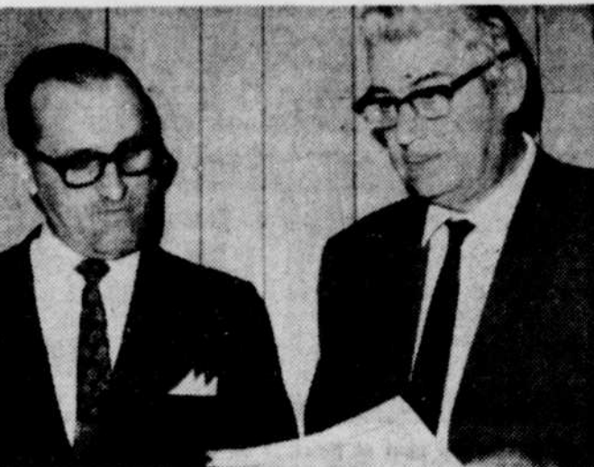
LE DIRECTEUR GENERAL DE L'HOPITAL STE-CROIX de Drummondville a convoqué une conférence de presse hier soir afin de faire savoir que le ministère de la Santé avait accepté, en principe, le projet d'agrandissement de l'hôpital.

Dans la sixième joute, les Blues ont triomphé de justesse des Stars par le pointage de 2-0 des Pingouins.