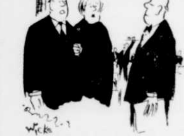
"Prenez-vous de l'argent comptant?"

Krumm Heller, qui est le fils d'un voyant célèbre autour de plus de 100 livres consacrés aux sciences occultes, annonce également que la 3e guerre mondiale n'éclatera pas avant 1973.