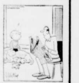
"Je n'ai pas l'intention de vendre tes chiens. Ainsi, tu peux arrêter de déchirer la partie du journal où il est question de personnes désireuses de se procurer un chien". (Annonces classées pages 14-15)