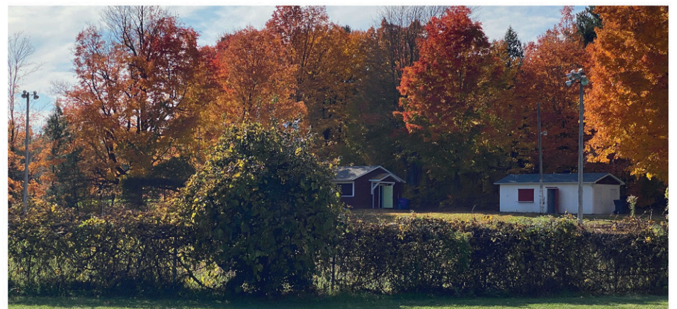
La première édition de la fête citoyenne aura lieu au parc Duhamel du Canton de Bedford.

« Le comité organisateur a travaillé fort pour offrir une programmation festive et