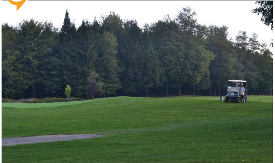
Le Club de golf de Cowansville avait accueilli ce même tournoi en 2019.