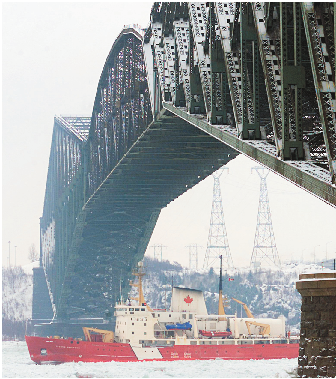
Inauguré officiellement en 1919, le pont de Québec a été désigné lieu historique national en 1996.

Dans ce commentaire, M. Blaney touchait un point très important, car l'objectif d'une compagnie privée n'est pas d'entretenir des œuvres de génie, mais de faire des profits. A partir de cette compréhension des choses, un pont tel que le pont de Québec aurait toujours dû être une infrastructure publique.