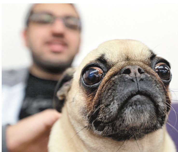
«Les animaux de compagnie: soins et exigences d'un propriétaire averti» figure parmi les cours complémentaires offerts dans les cégeps.

«L'influence des drogues», «Le plaisir et la douleur», «Les animaux de compagnie: soins et exigences d'un propriétaire averti»... Cela vous rappelle-t-il les titres accrocheurs des livres psycho-pop vendus à la caisse de la pharmacie du coin? Ce sont plutôt ceux des cours complémentaires offerts dans un cégep près de