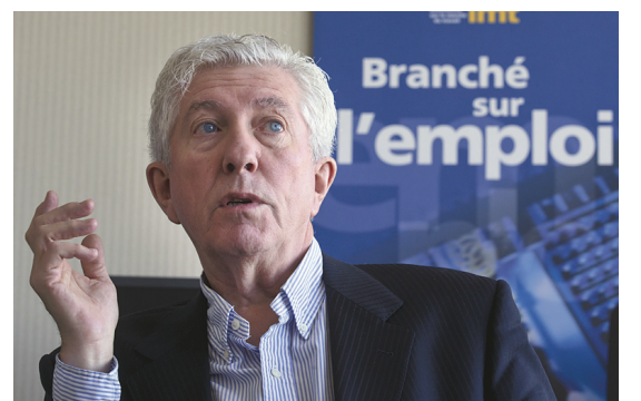
Plusieurs personnes, au sein du Bloc québécois, souhaiteraient le retour de Gilles Duceppe.

L'éditorial d'Antoine Robitaille: Existence nécessaire. Page A 6