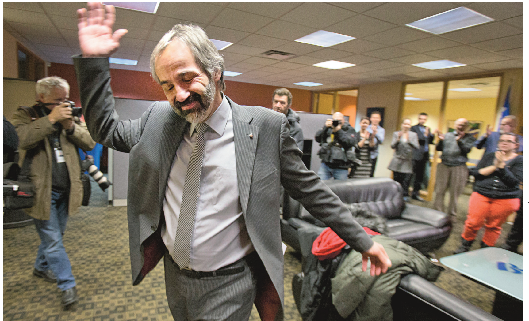
Daniel Paillé saluant son équipe après sa démission comme chef du Bloc québécois, lors d'une conférence de presse empreinte d'émotion, lundi à Montréal.

L'ancien chef ne ferme pas la porte à un retour, évoqué au sein du parti