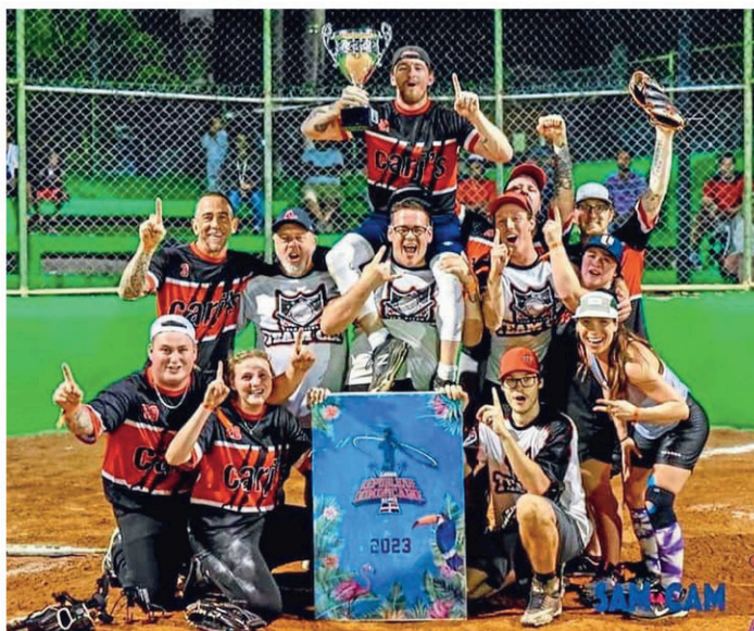
Une équipe de la Mauricie, les Carcajous, a remporté un tournoi de balle donnée mixte en République dominicaine.

Dans l'équipe, on retrouvait des joueurs de Shawinigan et de Saint-Tite.