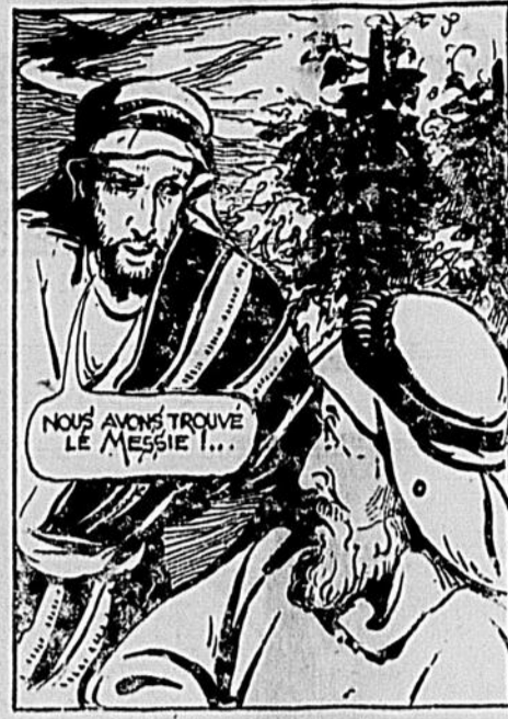
2. Ils font route ensemble et passent la soirée à causer, de telle sorte que les jeunes gens sont enthousiasmés. Au matin, André s'en va à la rencontre de son frère Pierre, arrivé sans doute avec ces caravanes qui viennent recevoir le baptême. "Nous avons trouvé la 'Messie', viens voir", lui dit-il, hors d'haleine; et Pierre se laisse entraîner.