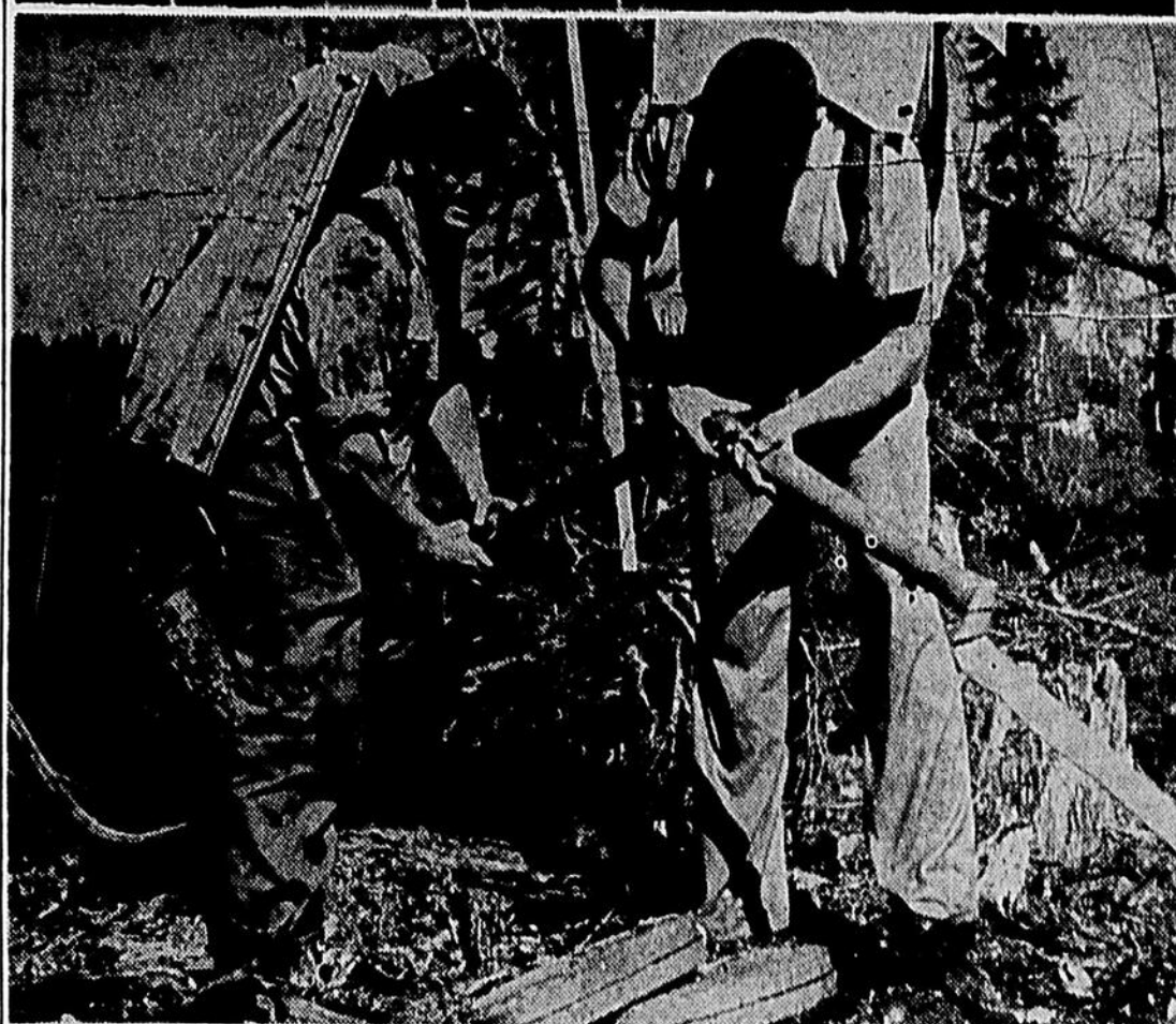
Pour la première fois au Canada, on a fait l'essai, au moyen d'avions "Stearman", d'une solution chimique pour maîtriser les incendies de forêts. Il s'agit du bombardement des arbres à l'aide de borate de calcium sodique qui empêche les flammes de se propager, en attendant l'arrivée de l'équipe de terre qui poursuivra la lutte contre le feu au moyen d'équipement ordinaire: pompes, boyaux, etc.