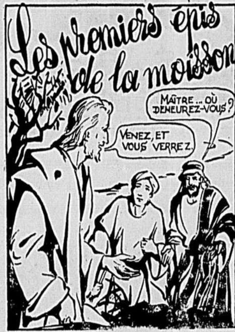
1. Revenu du désert, Jésus marche le long du Jourdain. Jean-Baptiste l'aperçoit, sa rude face s'adoucit: "Voilà l'Agneau de Dieu, celui qui efface les péchés du monde". Deux jeunes disciples de Jean — deux pêcheurs — se mettent à suivre cet homme extraordinaire. N'osant l'aborder, ils suivent en silence, guettant l'occasion... Jésus qui le sait, se retourne et dit: "Que voulez-vous?"