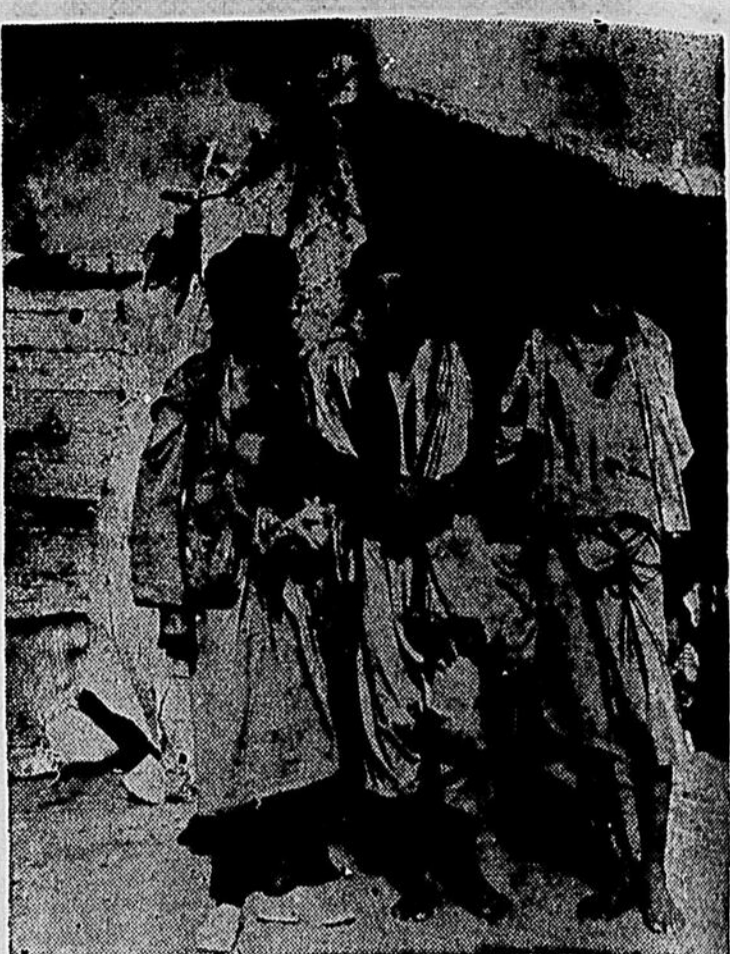
Les deux tiers de la population mondiale souffre de la faim; les besoins dans de nombreux pays et sur des continents entiers sont au-delà de l'imagination, par leur immensité et leur urgence. Les populations faméliques tendent la main, comme le font ces miséreux que nous montre cette photo et qui habitent près des Lieux Saints.

la dignité de Chevalier de St-Grégoire le Grand.