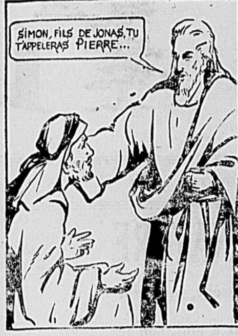
3. Arrivé devant l'homme extraordinaire, dont lui a parlé André, Pierre ne sait que dire. Mais Jésus lui met la main sur l'épaule et le regarde profondément, et d'un: parole s'en va à la rencontre de son frère Pierre, arrivé sans doute avec ces caravanes qui viennent recevoir le baptême. "Nous avons trouvé la 'Messie', viens voir", lui dit-il, hors d'haleine; et Pierre se laisse entraîner.