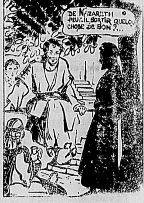
4. Ensuite, suivi de Pierre, André et Jean, Jésus remonte vers le Galilée. En route, il trouve Philippe. L'ami de ce dernier, Nathanaël, est assis à l'ombre et passe gaiement le temps. A la question de Philippe, il répond d'abord par une plaisanterie, puis il se lève et vient voir. L'étonnant charpentier de Nazareth le conquiert comme les autres, et Nathanaël vient grossir la petite troupe. C'est les premiers épis de la moisson qui est venue.

Réalisé par la SOCIÉTÉ CATHOLIQUE DE LA BIBLE.