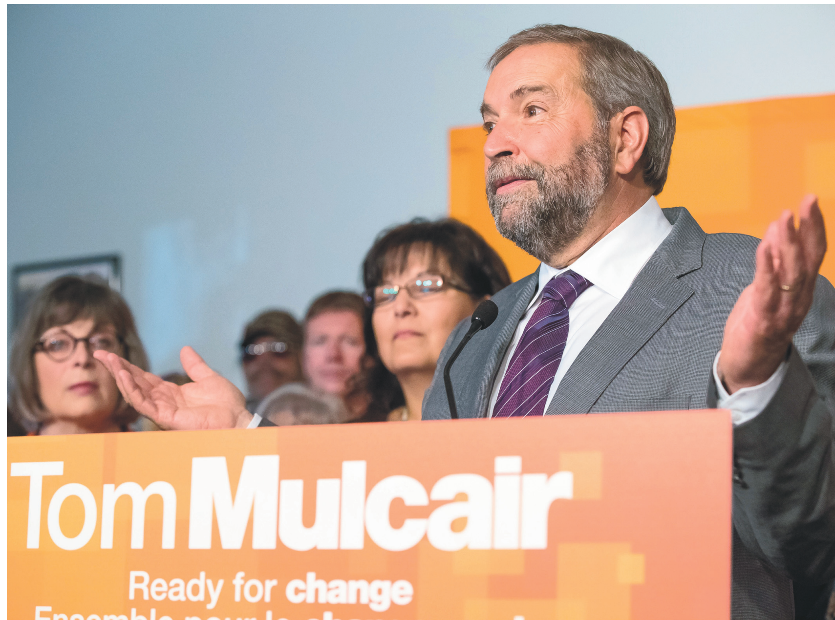
Le chef néodémocrate, Thomas Mulcair, était de passage à Saskatoon lundi pour une annonce concernant la lutte contre la violence faite aux femmes.