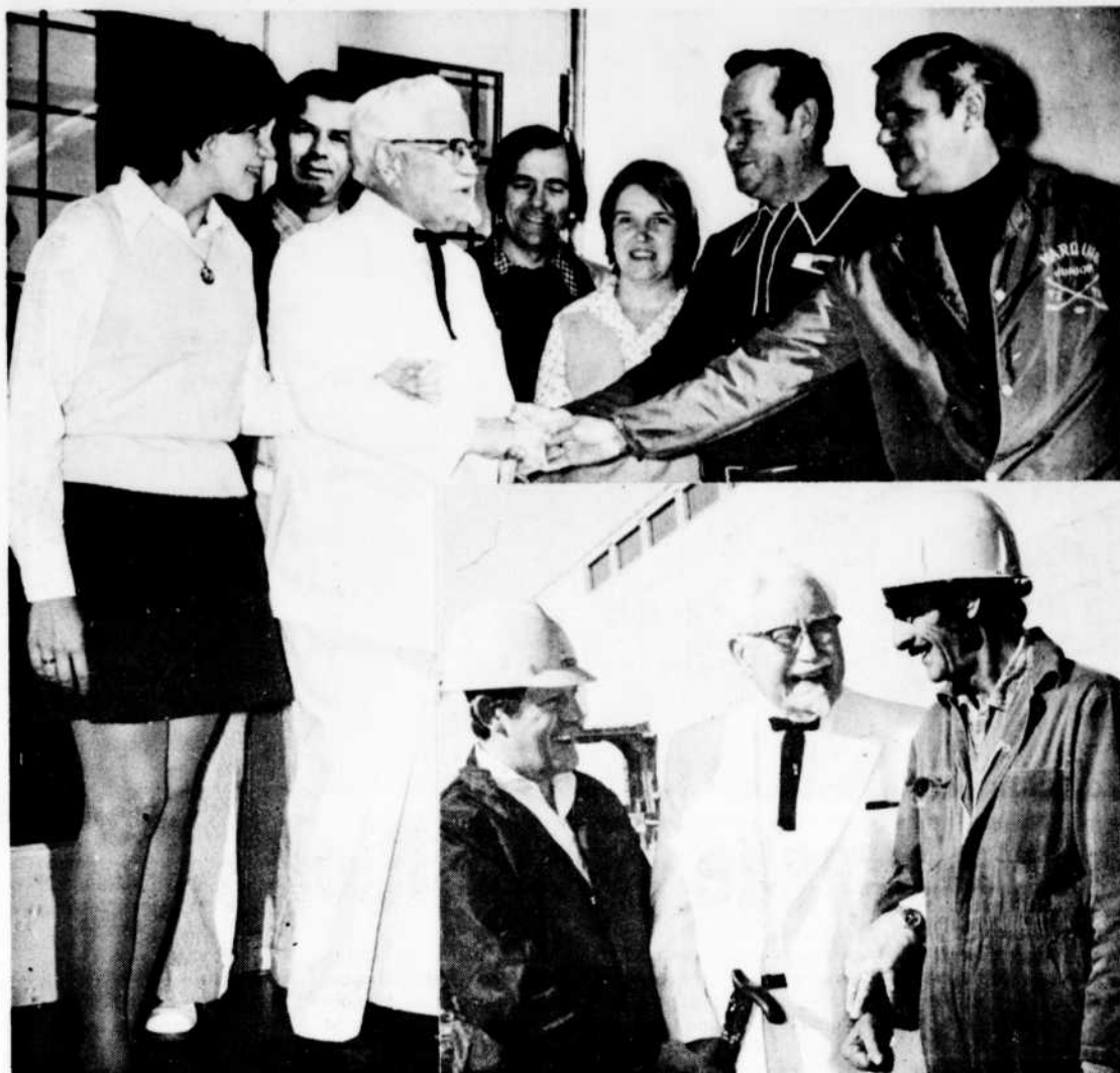
LE COLONEL SANDERS aime les gens et il l'a démontré une fois de plus lors de sa récente visite à la centrale hydro-électrique de l'Alcan à Shipshaw. On reconnaît le grand personnage d'abord en compagnie de