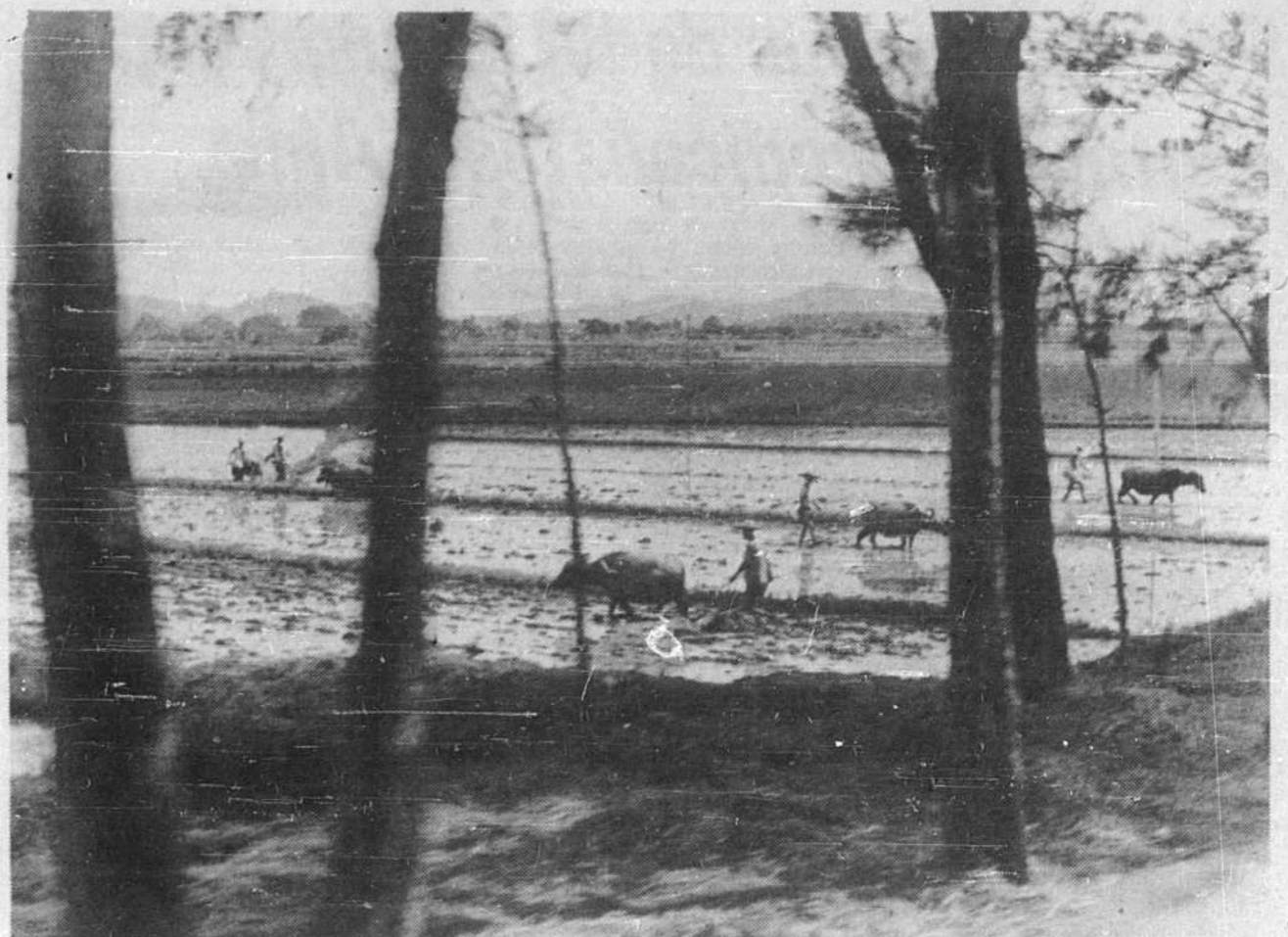
Les Chinois tirent deux et même trois récoltes de riz, selon les régions, de leurs terres irriguées. La première moisson s'effectue à la fin de juin; sitôt qu'elle est engrangée, les rizières sont inondées et les buffles sont mis au labour.