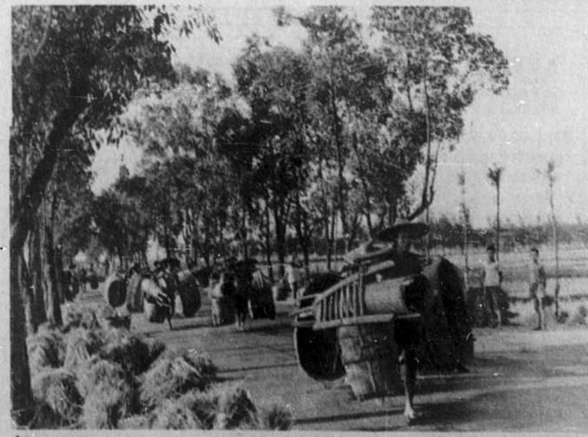
"Ils surgissent de cette vaste fourmière par grappes compactes, pour cultiver leurs champs..."