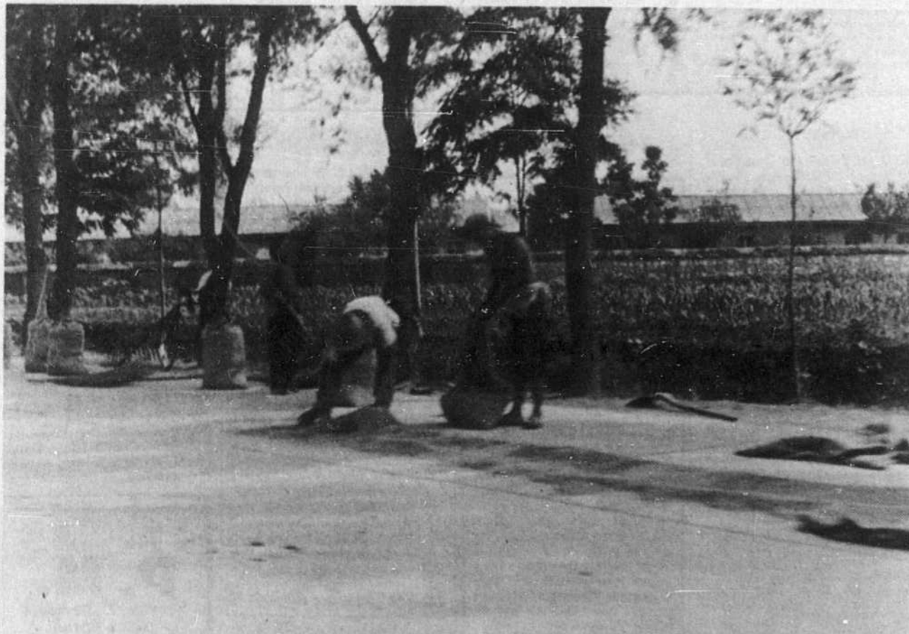
Sur la chaussée de la route nationale, des paysans du Kwangtung étendent leur grain pour le faire sécher au soleil.

Ayant le soleil rouge dans le cœur, De puissants contingents livrent combat aux Taihang. La pensée Mao Tsé-toung étant au poste de commandement, Le pays présente un aspect nouveau, captivant. Ayant le soleil rouge dans le cœur, De puissants contingents livrent combat aux Taihang. Ils font la révolution avec le marteau et le poignoir. En s'inspirant de la volonté de fer de Yukong. A flanc abrupt coulent en zigzag d'innombrables canaux; Dans les réservoirs, le ciel d'azur se reflète sur le miroir des eaux. Les versants se trouvent jonchés d'une verdure épaisse. Aus champs de type de Taichai, les montagnes arides font place. Au travers des monts Taihang fendus, La rivière Tchangho' vient, impétueuse. La population de Linhsien accomplit des miracles par ses propres forces; Et brandissant le drapeau rouge, en avant elle poursuit sa marche.