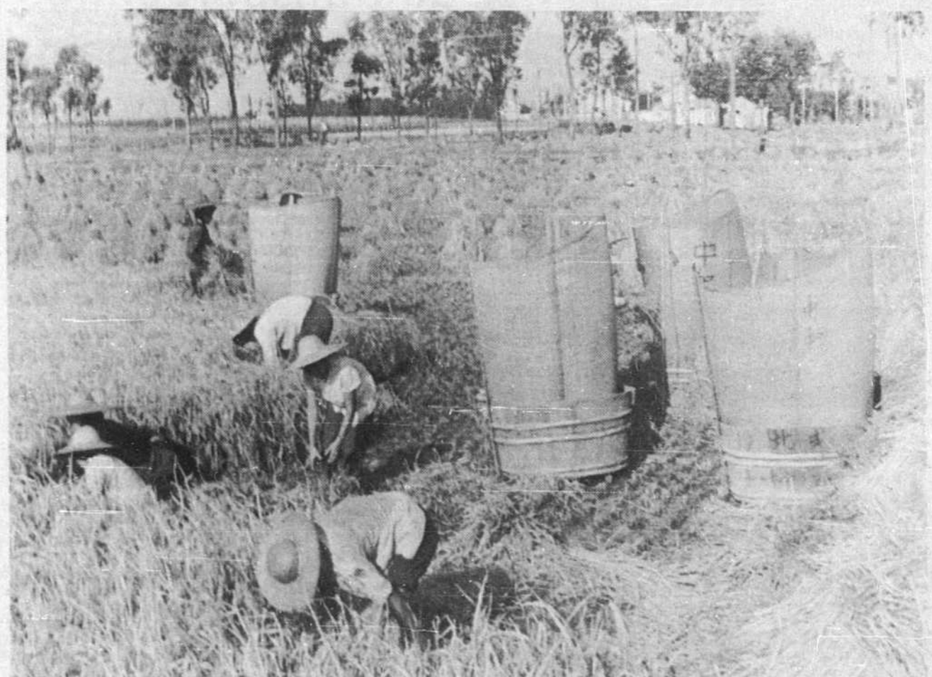
Selon le premier ministre Chou En-lai, la Chine a produit en 1970 environ 240 millions de tonnes de céréales, chiffre suffisant, selon lui, pour nourrir sa population. Au surplus, les réserves de céréales ont atteint 40 millions de tonnes. En conséquence, les importations sont tombées en deçà de un pour cent de la production nationale.