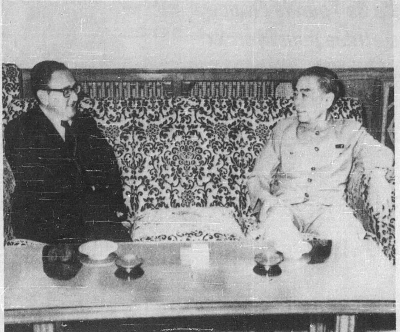
M. Henry Kissinger, conseiller du président Nixon, en compagnie du premier ministre Chou En-lai, le 9 juillet, dans la résidence mise à sa disposition par le gouvernement chinois.

C'est donc vers un nouveau rapport des grandes forces mondiales que l'administration américaine paraît s'acheminer aujourd'hui, s'écartant délibérément du vieux schéma de la confrontation bilatérale entre les deux super-grands que sont l'Amérique et l'URSS. Cette évolution inquiète évidemment l'URSS.