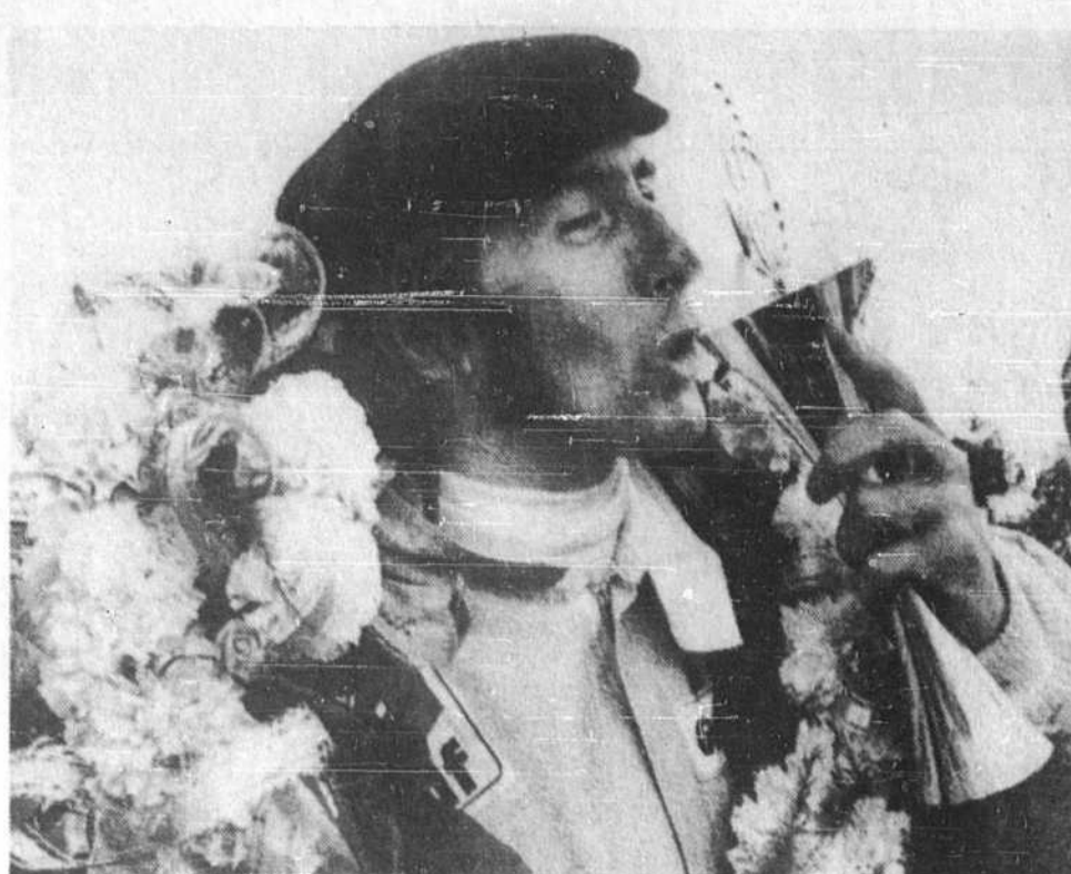
LA COUPE AUX LÈVRES! L'Écossais Jackie Stewart connaît une saison fantastique au championnat mondial des conducteurs de Formules 1. Il a gagné, avant-hier à Silverstone, le Grand Prix de Grande-Bretagne. Pour lui, la coupe proverbiale ne semble jamais tellement loin de ses lèvres, puisqu'il s'agissait de son 4ème triomphe en six épreuves.