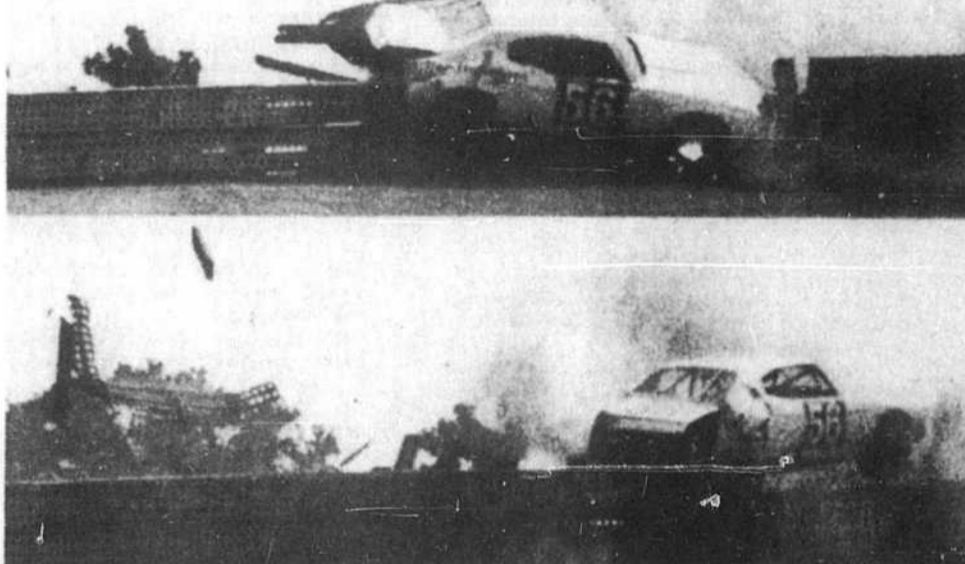
ÇA S'APPELLE "DANS LE DÉCOR"! Le pilote Jim Hurtbise n'a pas eu de veine, samedi à la piste de Trenton (N.-J.), au cours d'une épreuve de qualification en vue de la course NASCAR "Northern 300" disputée hier. Sa voiture a dérapé pour foncer dans la clôture protectrice, dont 30 pieds se sont littéralement envolés.