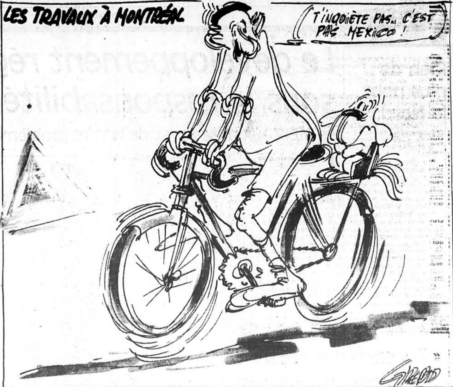
Reprise - Girend est en vacances