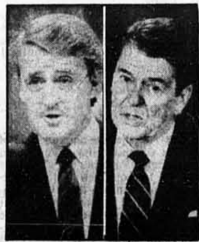
Une rencontre cruciale...

Les groupes de citoyens canadiens défendant les intérêts des réfugiés entreprendront aujourd'hui un jeûne d'une semaine en guise de protestation contre le projet de loi fédéral sur l'immigration. La coalition de nombreux groupes affirme que les amendements à la Loi sur l'immigration proposés par le ministre fédéral de l'Immigration, Benoît Bouchard, auront pour résultat de rendre impossible l'entrée au Canada pour la plupart des réfugiés. Des manifestations auront lieu dans au moins 20 villes canadiennes, de Victoria, en Colombie Britannique, jusqu'à Saint-John's, à Terre-Neuve.