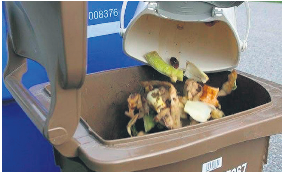
La collecte à trois voies devrait voir le jour l'an prochain à Gaspé.

ENVIRONNEMENT. Un peu plus tôt cet été, la Ville de Gaspé a adopté un règlement d'emprunt et une dépense de 460 000 $ pour l'aménagement d'un écocentre.