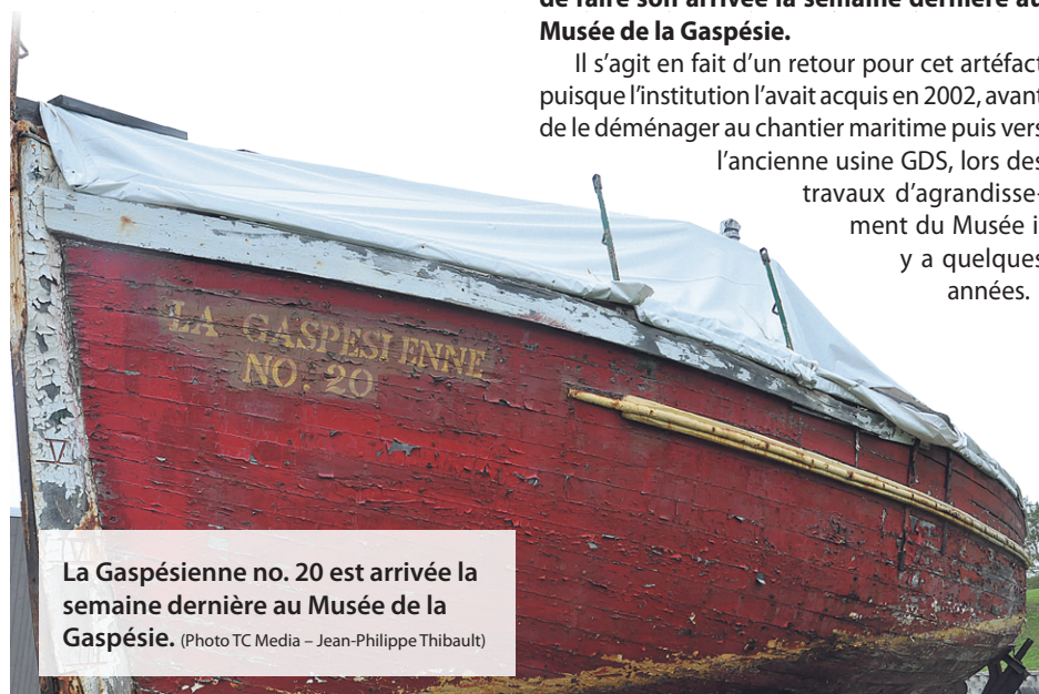
La Gaspésienne no. 20 est arrivée la semaine dernière au Musée de la Gaspésie.

D'autres Gaspésiennes sont encore en opération au Québec, comme la no. 26 aux Îles-de-la-Madeleine, mais elle a été fortement modifiée au fil du temps. Une autre se situe tout près, à Rivière-au-Renard. Le temps a toutefois eu le dessus sur l'embarcation qui ne pourrait vraisemblablement pas être restaurée. Au final, une fois installé sur le site du Musée, il s'agira du seul navire historique que l'on pourra visiter en Gaspésie.