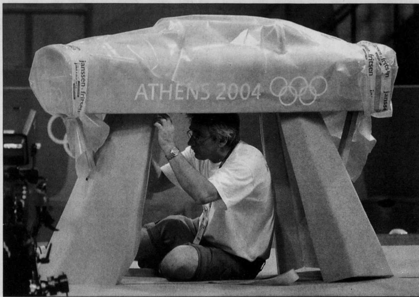
Un ouvrier procédait au réglage final, hier à Athènes, du cheval d'arçon qui servira aux Jeux qui débiteront vendredi prochain.

Il y a moins d'un an, il n'y avait pas de tramway dans le centre d'Athènes ni de train de banlieue