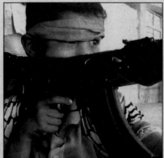
Un enfant joue les miliciens dans les rues de Najaf.