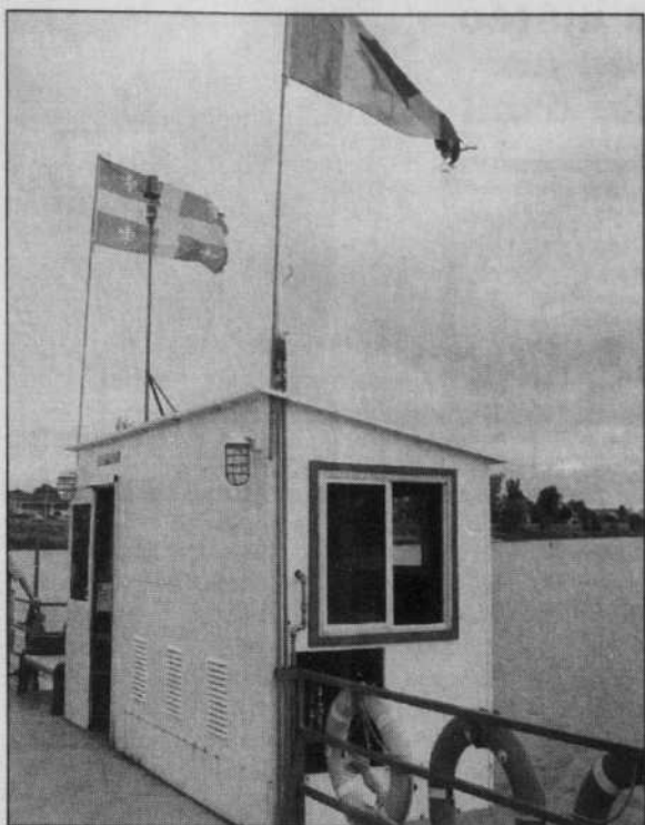
Pour traverser le Richelieu, il suffit d'embarquer dans de petits traversiers comme celui-ci.