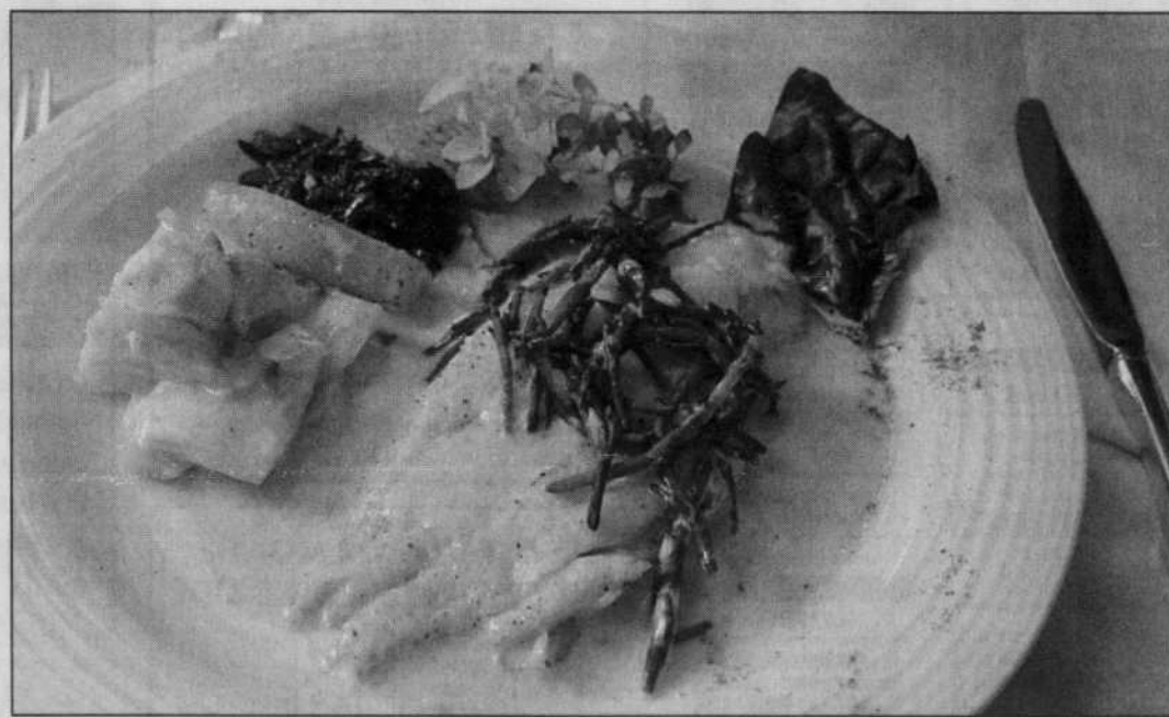
Un filet d'aiglefin étuvé que viennent compléter en finesse un beurre citronné et ces délicieux cornichons de mer que l'on appelle salicornes.

Prix payé pour deux avec taxes et avant service: 91 $, deux brunchs à 23,95 $ avec un thé, un espresso, une bouteille de côte du Roussillon villages.