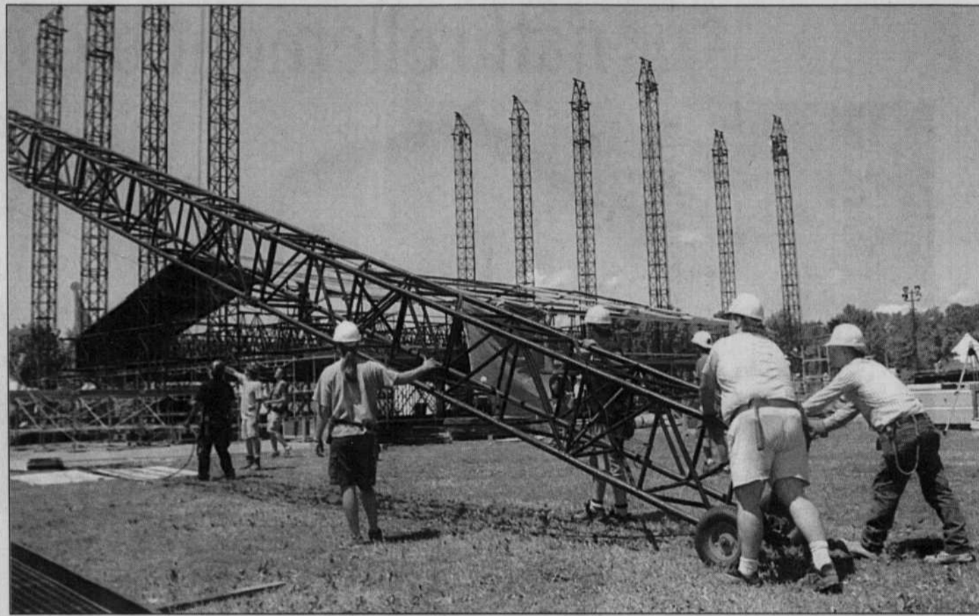
JACQUES GRENIER LE DEVOIR

METALLICA et la tournée Summer Sanitarium débarquent au parc Jean-Drapeau, dimanche. Déjà, plus de 40 000 billets se sont envolés pour voir Mudvayne, Deftones, Linkin Park et Limp Bizkit, en plus des vétérans et pionniers du métal. La scène, plus grande que la surface de la patinoire du Centre Bell, demande trois jours de montage à raison de 18 heures par jour. Trois de ces scènes complètes se déplacent durant la tournée. Trente-sept camions sont utilisés pour ce spectacle, dont 22 pour les équipements sonores et visuels. Trois cents personnes assureront la sécurité de ce méga-concert de métal. La dernière visite de Metallica à Montréal remonte au 28 mars 1997, au Centre Bell, alors le Centre Molson.