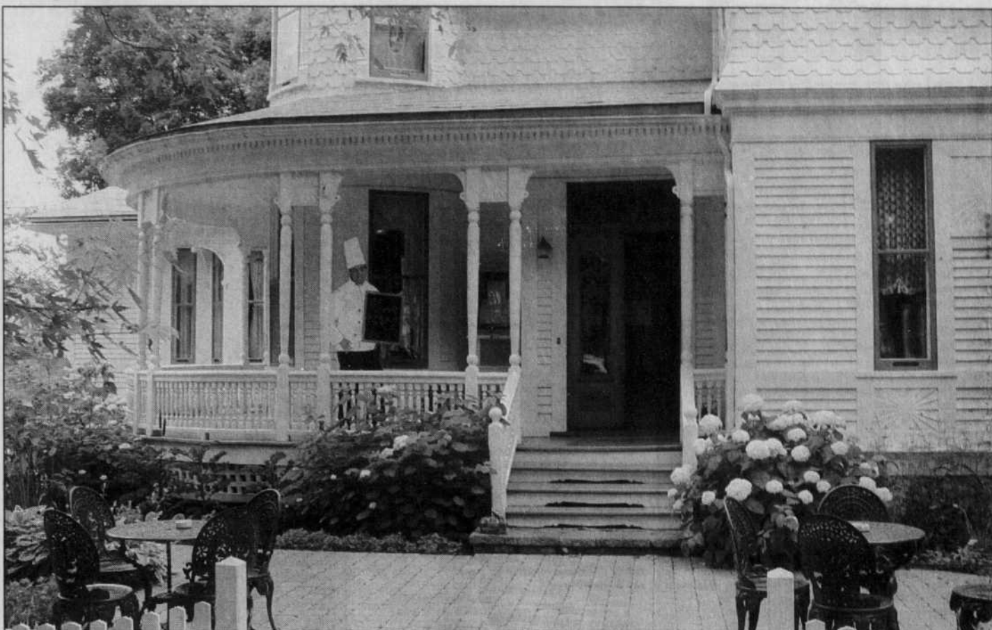
Cette ancienne maison de médecin conserve encore des vestiges de 1905, date de la fondation de cette demeure quasi centenaire.