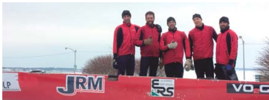
L'équipe de l'Isle-aux-Grues.