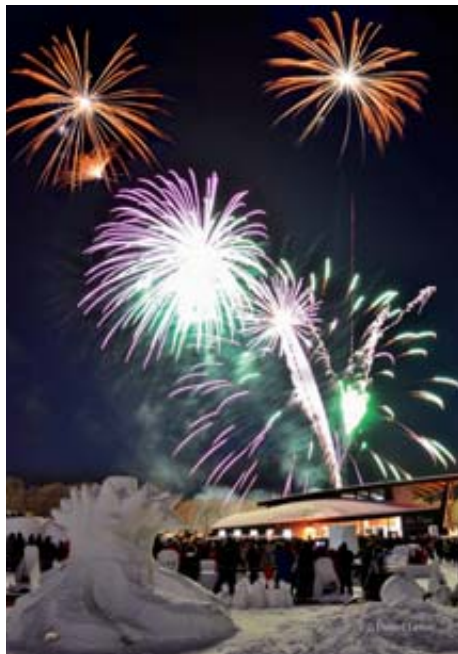
Le feu d'artifice du samedi soir attire toujours beaucoup de gens.

La Fête d'hiver de Saint-Jean-Port-Joli demeure l'évènement hivernal majeur sur la Côte-du-Sud. Les détails de la programmation se trouvent sur fete-hiver.com .