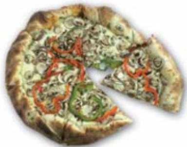
Pizza X-large garnie ou pepperoni fromage

Tournoi provincial Opti Pee-Wee de Montmagny