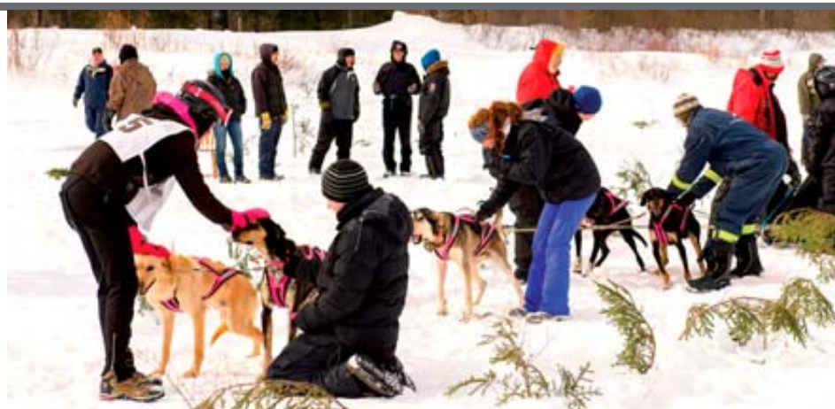
Verra-t-on à nouveau une telle scène à Saint-Just l'an prochain?

Chose certaine, si les organisateurs décident de laisser tomber les compétitions de traîneau à chiens, ils trouveront un autre événement hivernal pour attirer les gens dans le Parc des Appalaches, de conclure Daniel Racine.