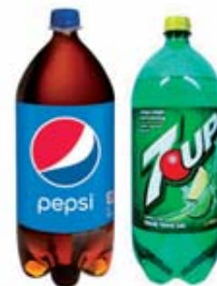
Produit Pepsi 2 litres