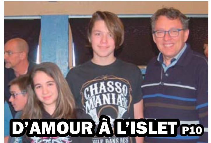
D'AMOUR À L'ISLET P10