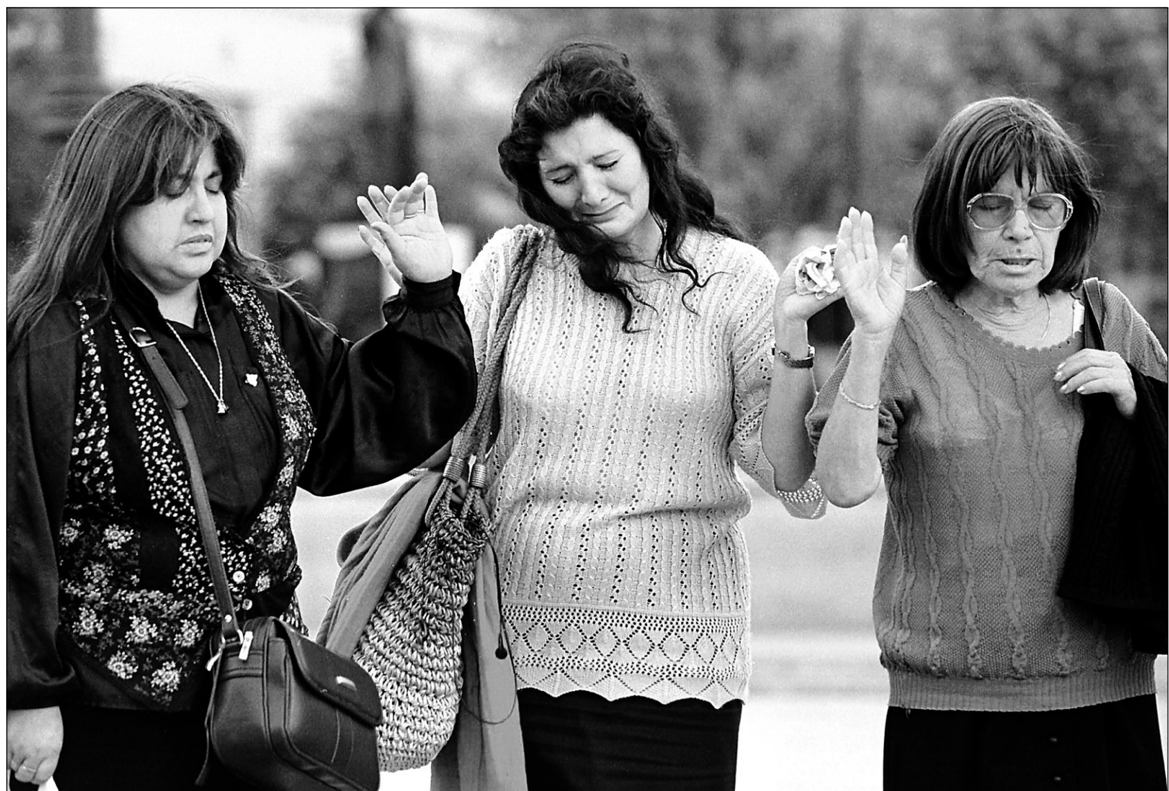
Des membres d'une église évangélique du Chili prient pour la paix et la réconciliation devant le palais présidentiel, à Santiago.