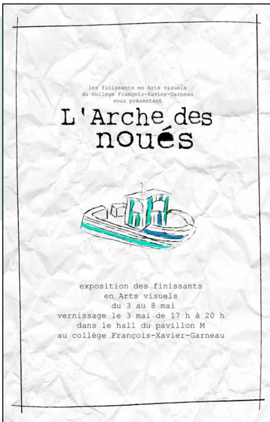
Affiche de l'exposition réalisée par Emily Gagnon