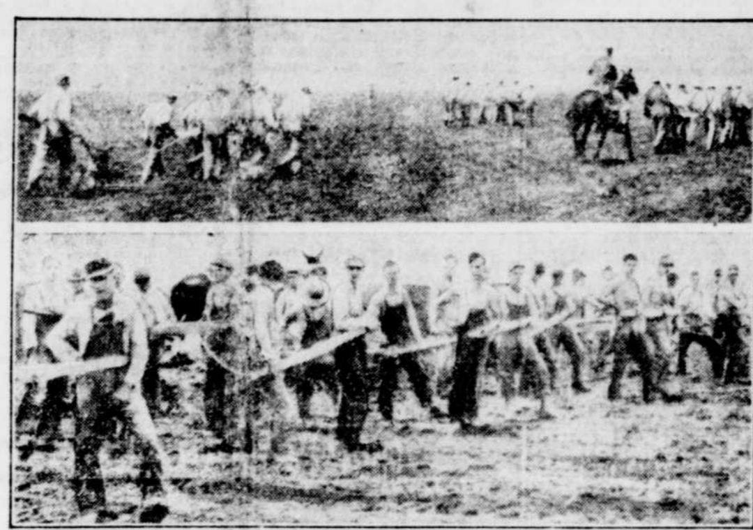
Le manque de mules explique pourquoi ces prisonniers, à la prison de Tucker, en Arkansas, sont attelés à des charrues pour labourer les champs de coton. Bien que les autorités disent que les charrues n'enfoncent que de deux pouces dans le sol et que le travail n'est pas exténuant, le gouverneur Futtrel a mis fin à cette pratique. Les vignettes ci-dessus représentent les forçats au travail et au repos.