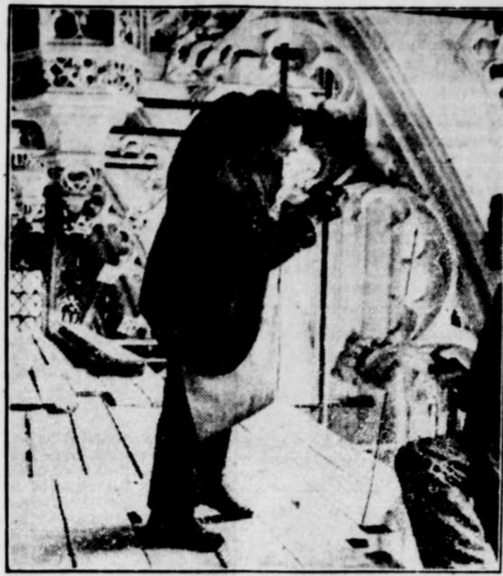
Les splendeurs de la chapelle de Henri VIII dans l'Abbaye de Westminister ont été longtemps cachées à la vue des visiteurs par d'épaisses toiles et des échafaudages. Maintenant, un an après la rénovation de la chapelle, le danger que présentait la maçonnerie du toit est disparu et il ne reste plus qu'à nettoyer les sculptures de la chapelle. Ce travail prendra cependant un an, vu son caractère délicat.