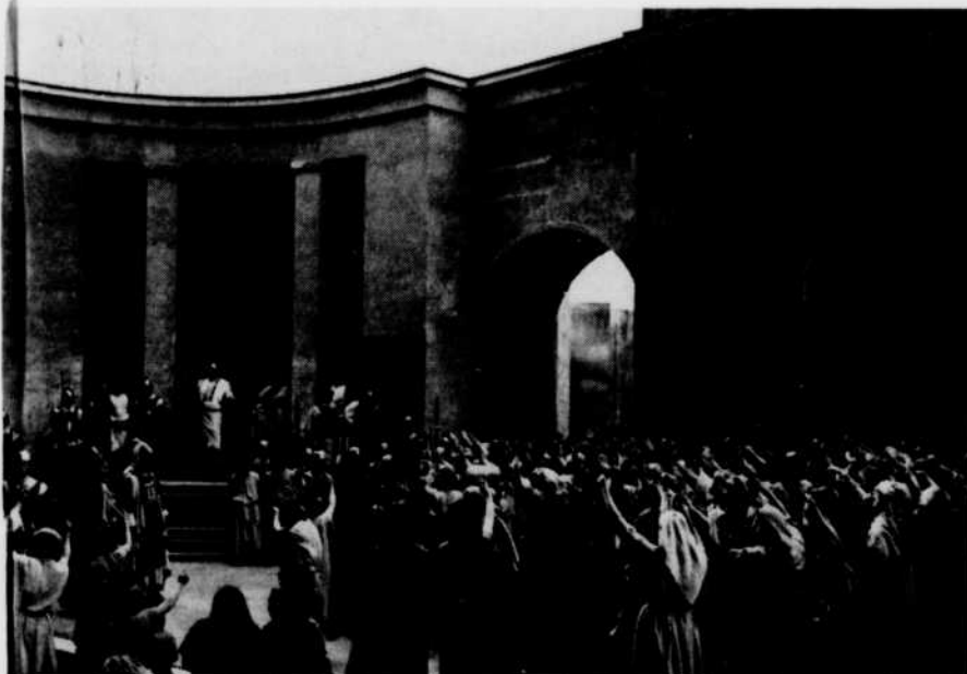
Au palais de Pilate

Rond-Point est une réalisation d'André Hamelin. C'est une production du Service des Reportages de Radio-Canada.