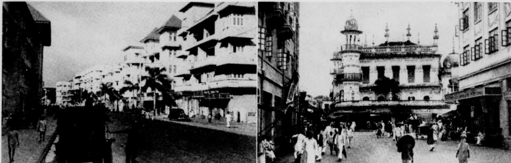
À Bombay, la signature de l'Occident