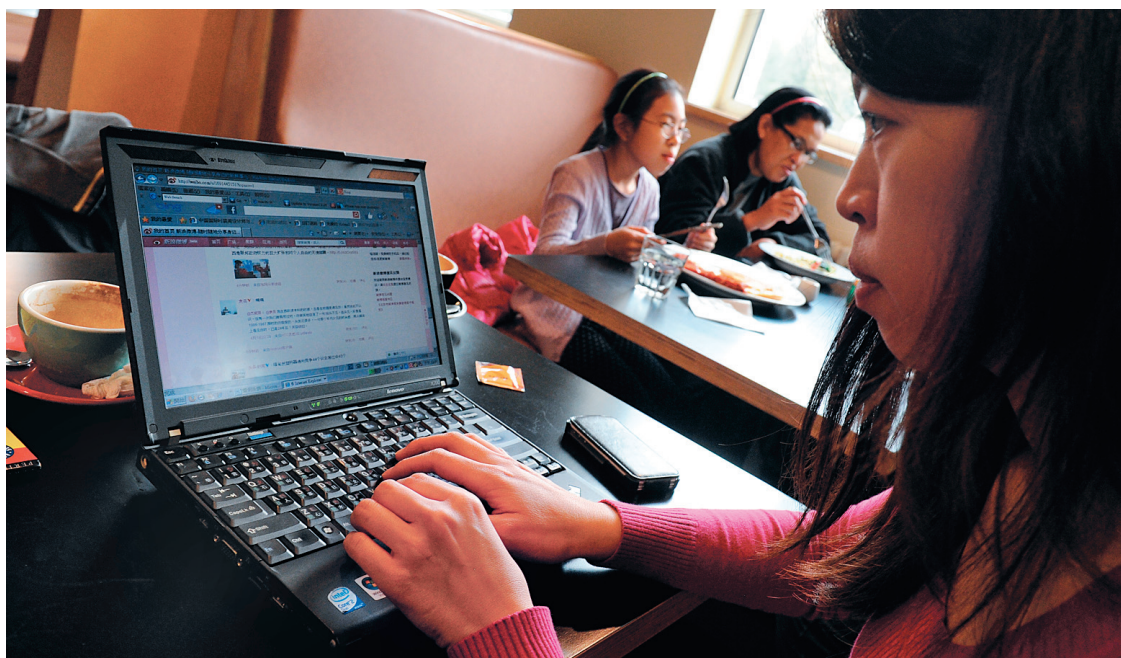
Une jeune femme atablée dans un café de la capitale chinoise consulte l'un des réseaux sociaux que les sites officiels ont du mal à égaler.

Les sites officiels ont par ailleurs raté le virage du Web participatif. Le Quotidien du peuple a mis en place sa plateforme de microblogs, sans succès, tandis que l'équivalent de Twitter, lancé en 2009 par Sina, dépasse aujourd'hui les 300 millions d'utilisateurs. People.com.cn reconnaît dans sa brochure d'introduction en