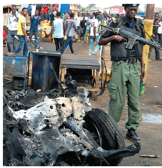
Voiture piégée à Kaduna, dans le nord du Nigeria

Selon un porte-parole militaire, des islamistes présumés ont mené dans la nuit de dimanche à hier une attaque dans la ville de Dikwa, dans l'État de Borno, où Boko Haram a sa base.