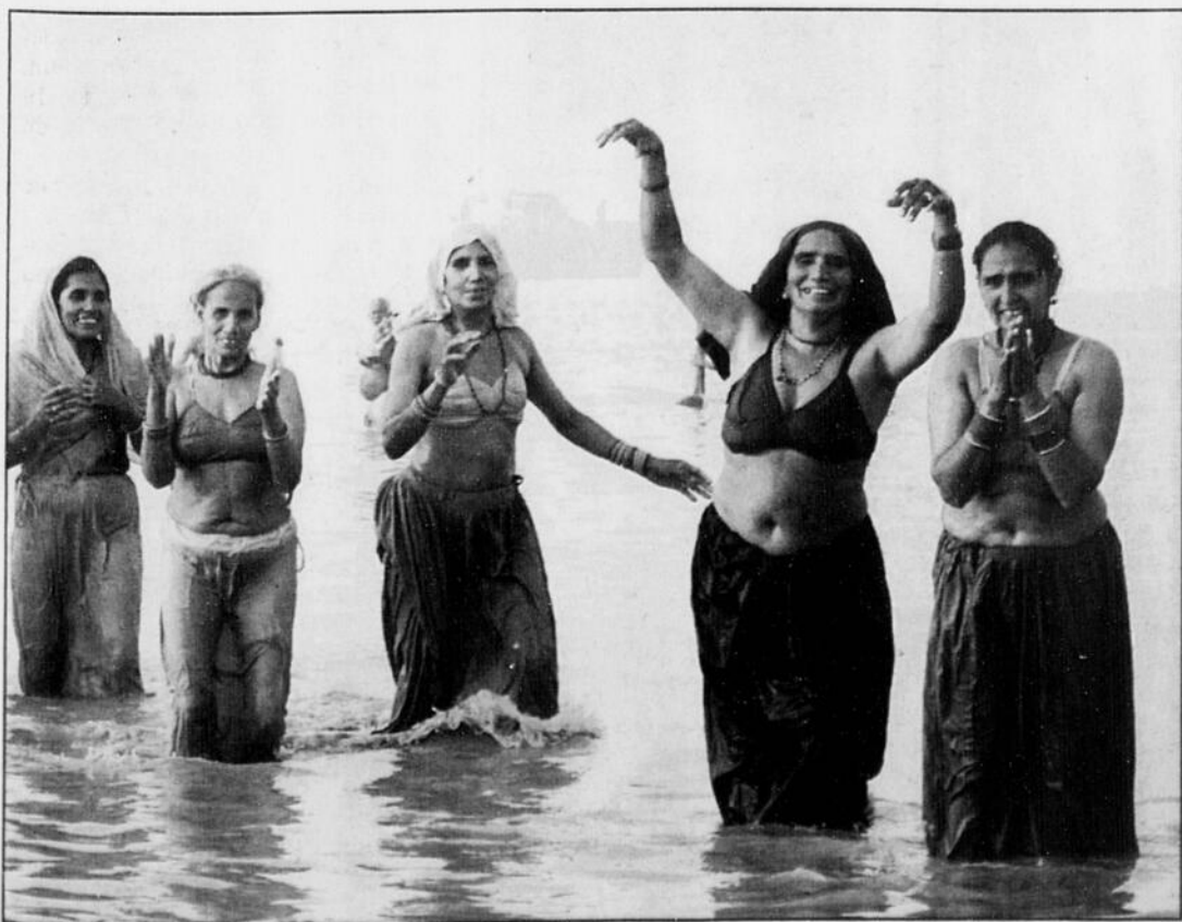
Six femmes indiennes prennent un petit bain purificateur dans le fleuve Gange, au Sud de Calcutta, un peu avant le Festival Hindou de Makar Sankranti, qui s'ouvre aujourd'hui.