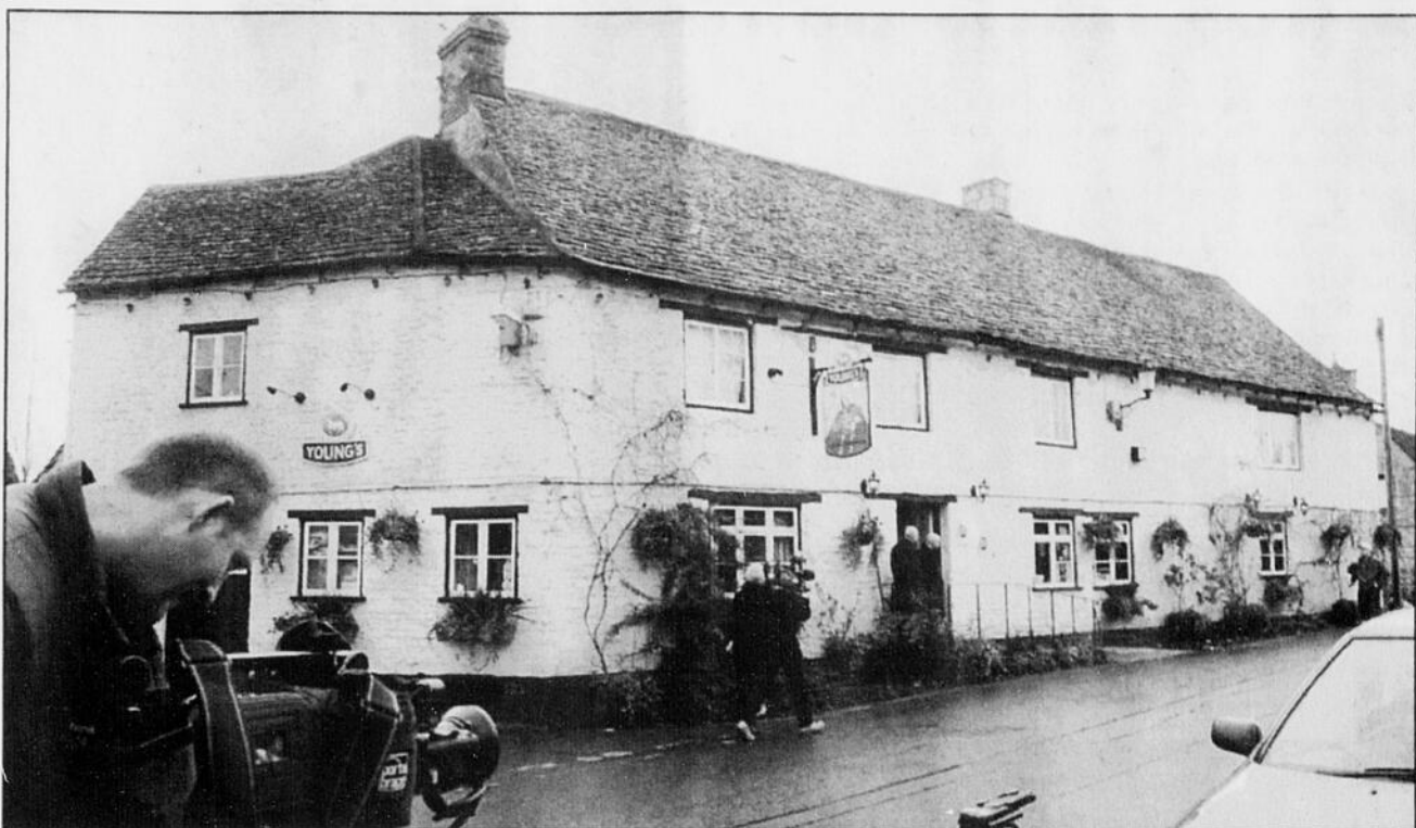
Un caméraman filme l'auberge Rattlebone Inn, à Sherston, où le prince Harry, alors âgé de 16 ans, aurait consommé de l'alcool, l'année dernière. Harry, troisième dans l'ordre de succession au trône, a fumé des joints et bu des pintes de bière durant deux mois, l'été dernier avec des amis, dans des fêtes privées et dans un pub près de la propriété paternelle de Highgrove, dans l'ouest de l'Angleterre, selon «News of the World».

Le sondage a été réalisé auprès de 1516 Canadiens adultes, du 13 au 18 décembre dernier.