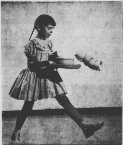
Molti incidenti verranno evitati con piatti di polipropilene "Pro-Fax". Questa sostanza è infrangibile; i piatti che cadono rimbalzano semplicemente; non si macchia ed è resistente al calore, cosicché ti o caffè non lasciano segno, e può essere lavata nell'acqua bollente di un lavapiatti automatico.

Io non starò a dire nulla di più di quanto ha scritto il "Corriere della Sera": il giorno dopo l'apertura del nostro maggiore teatro; Orso Vergani ha una penna tale che nessuno può imitare; sarebbe quindi troppo poco le mie parole in confronto alle sue; ed è per questo che le prendo in prestito da lui, ottimo amico che non me ne vorrà se ristampo le sue