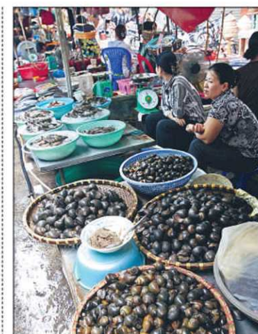
Le centre de Hanoi bat au rythme de son marché.

Il faut vivre un dimanche soir pour palper cette frénésie qui s'empare de la jeunesse d'Ho Chi Minh-Ville alors qu'elle s'adonne au chay rong rong (la grande randonnée en moto), sorte de dévouement collectif où des milliers de jeunes, à bord de leur moto, se donnent rendez-vous et font le tour pendant des heures de quelques pâtés de maisons du centre-ville sous le regard bienveillant de l'oncle Ho, dont la statue trône devant l'hôtel de ville, mais l'air inquiet des personnes plus âgées qui se demandent où s'en va la jeunesse.