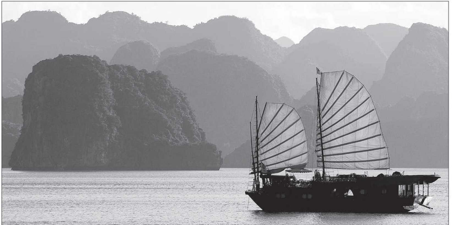
La mythique baie d'Along

Le bateau glisse sur l'eau calme et traverse un village de pêcheurs. Les plateformes flottantes sont éparpillées dans un coin reculé de la baie. Chaque plateforme reçoit trois ou quatre maisons en bois et autant de familles. Ses habitants semblent avoir été oubliés par le reste du monde, comme condamnés à dériver sans fin sur cet étrange territoire fantomatique. Mais les étoiles jaunes des drapeaux rouges hissés çà et là indiquent clairement qu'ils font partie de la nation vietnamienne.