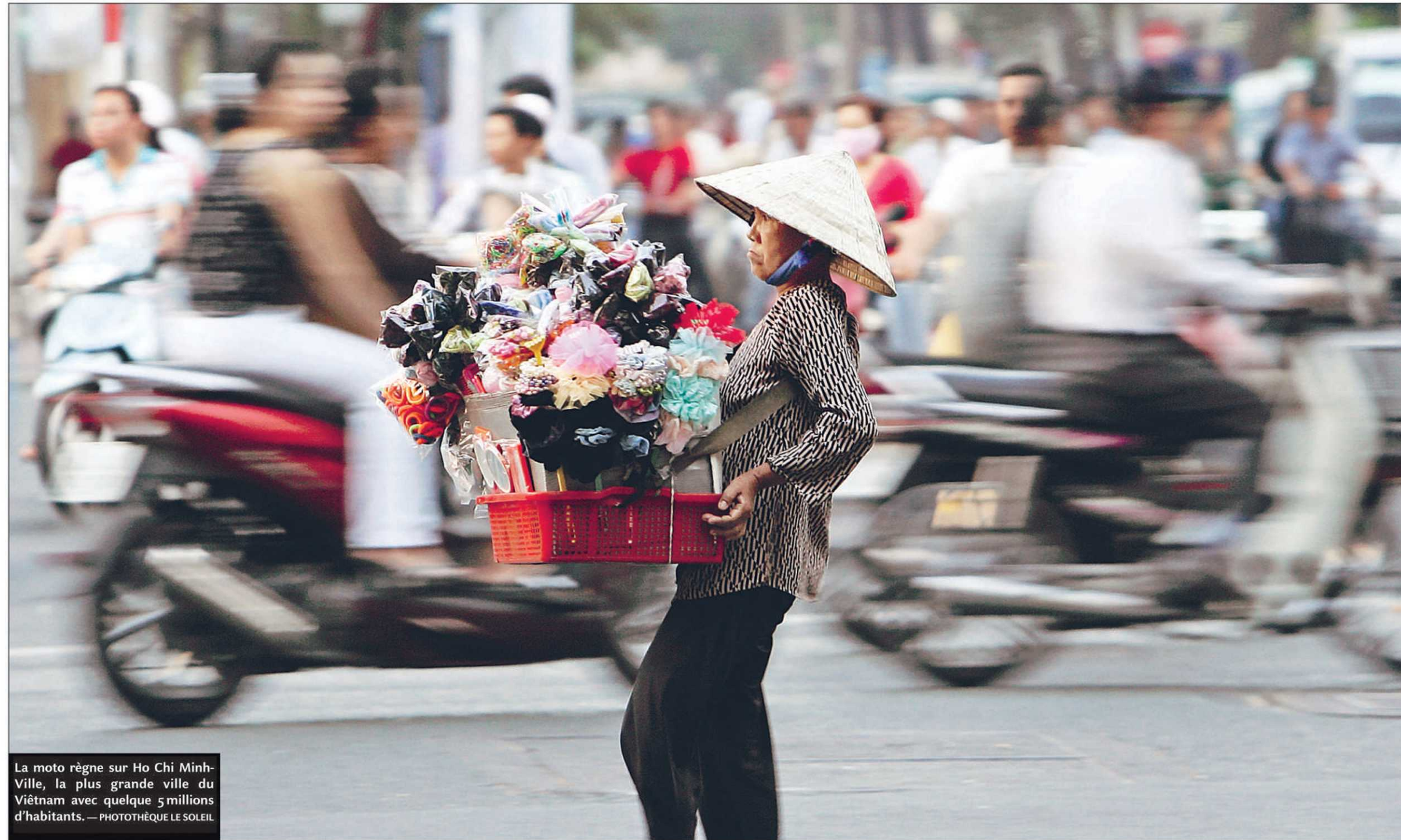
La moto règne sur Ho Chi Minh-Ville, la plus grande ville du Viêt Nam avec quelque 5 millions d'habitants.

Santé et sécurité : Dans le contexte de la grippe aviaire, les voyageurs qui vont au Sud-Est asiatique devraient éviter de consommer de la volaille ou ses produits dérivés ou s'assurer que ces produits sont bien cuits. Les voyageurs devraient éviter également tout contact direct avec la volaille vivante dans les marchés publics ou à la ferme.