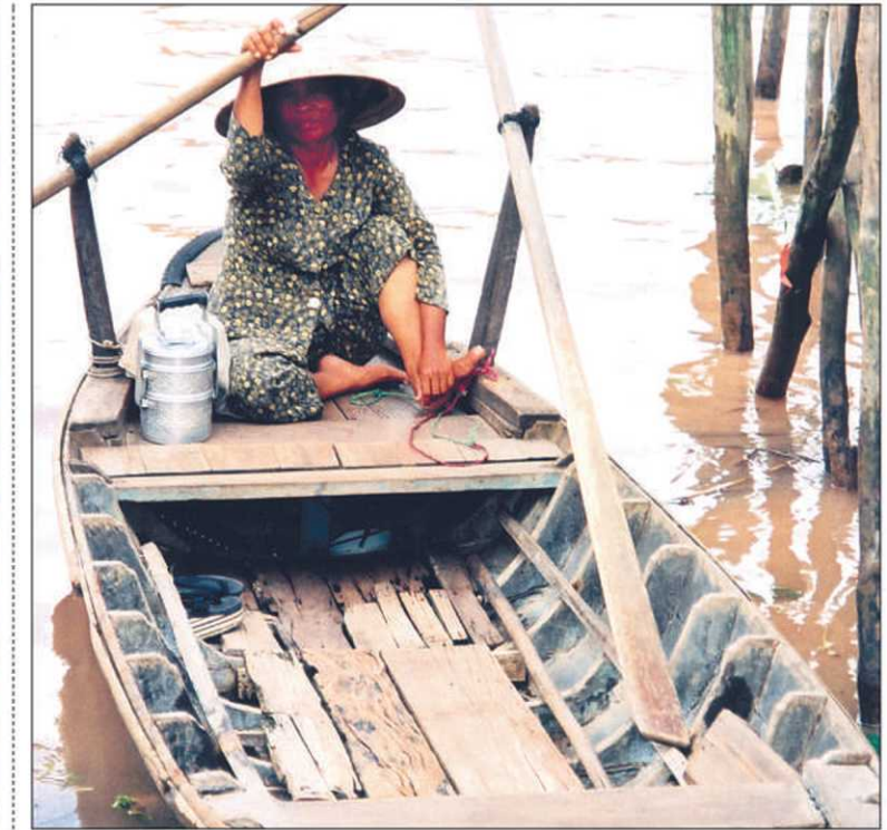
Vietnamienne assurant le transport des passagers entre les deux rives du Mékong à Can-Tho

Un voyage au Viêt Nam ne serait pas complet sans un détour dans la baie d'Along. Située à quelques heures de route au nord de Hanoi et considérée à juste titre comme l'un des plus beaux paysages au monde, la vue des quelques 3000 îles qui émergent du golfe de Tonkin comme autant de pains de sucre est à couper le souffle. On retrouve également le même paysage féérique à Ninh Binh, à quelques heures de route au sud de Hanoi, mais cette fois dans sa version terrestre avec ses cours d'eau tout en méandres et ses rizières.