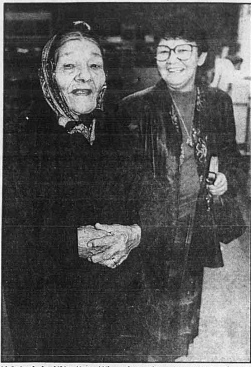
L'aînée de la délégation attikamek-montagnaise, qui ne parle que la langue traditionnelle de sa bande, s'appête à prendre l'avion en direction de Rome pour aller rencontrer le pape, en compagnie d'une vingtaine de compatriotes.