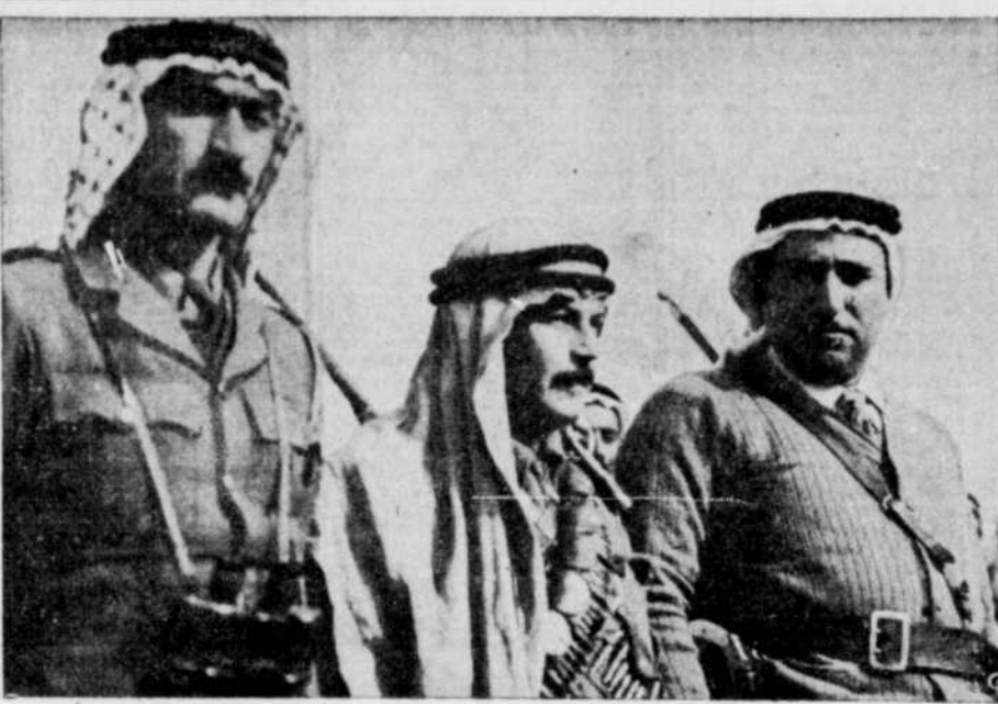
Reunion de chefs arabes — Pendant que les Nations Unies demandaient la formation d'une police internationale pour aider au partage de la Palestine...