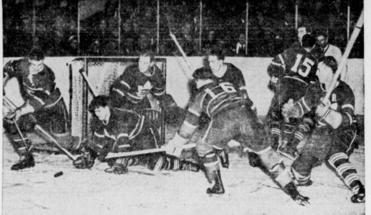
Gerry Plamondon vient près de compter — Le joueur de défense Elmer LACH (à gauche) des Canadiens, de même que Bill BARILKO, Howie MEEKER le gardien de buts TURK BRODA, alors que Gerry PLAMONDON tente et Teeter KENNEDY, des Leafs.