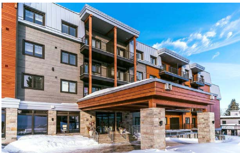
La Résidence des Laurentides de Sainte-Agathe-des-Monts