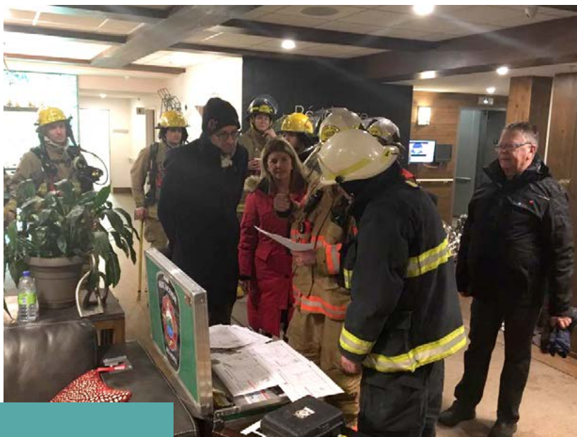
Évacuation à la Résidence des Laurentides.