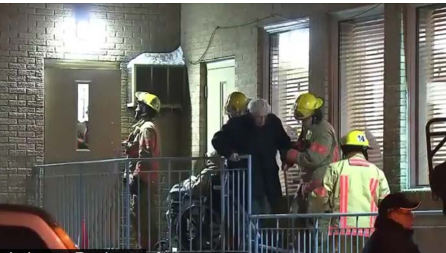
Évacuation à la résidence 6900 Papineau. reportage de Radio-Canada du 18 janvier 2019

LORSQUE L'ALARME INCENDIE COMMENCE À RETENTIR DANS UNE RÉSIDENCE POUR AÎNÉS, LA PANIQUE ET LA CONFUSION PEUVENT RAPIDEMENT S'INSTALLER. UNE COURSE CONTRE LA MONTRE S'ENGAGE ALORS POUR ÉVACUER TOUS LES OCCUPANTS VERS UN ENDROIT SÉCURITAIRE. DEUX RÉSIDENCES POUR AÎNÉS MEMBRES DU RQRA ONT ÉTÉ CONFRONTÉES À UNE TELLE SITUATION EN JANVIER DERNIER, PAR UN FROID POLAIRE DE SURCROÎT. FORT HEUREUSEMENT, TOUT S'EST TRÈS BIEN PASSÉ, GRÂCE AUX EFFORTS BIEN COORDONNÉS DES MEMBRES DU PERSONNEL EN PLACE AVEC CEUX DES ÉQUIPES D'INTERVENTION D'URGENCE. RÉCITS DE DEUX SOIRÉES MOUVEMENTÉES.