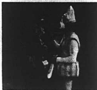
Sol et Gobelet