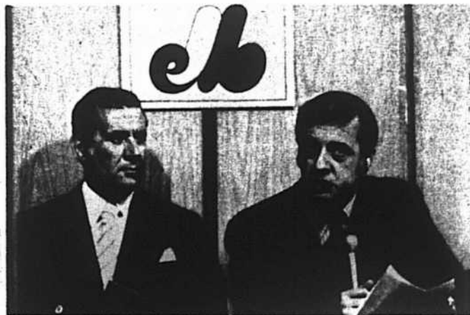
Radio-Canada au parc Jarry