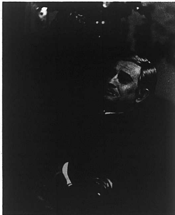
Georges Descrières dans Arsène Lupin