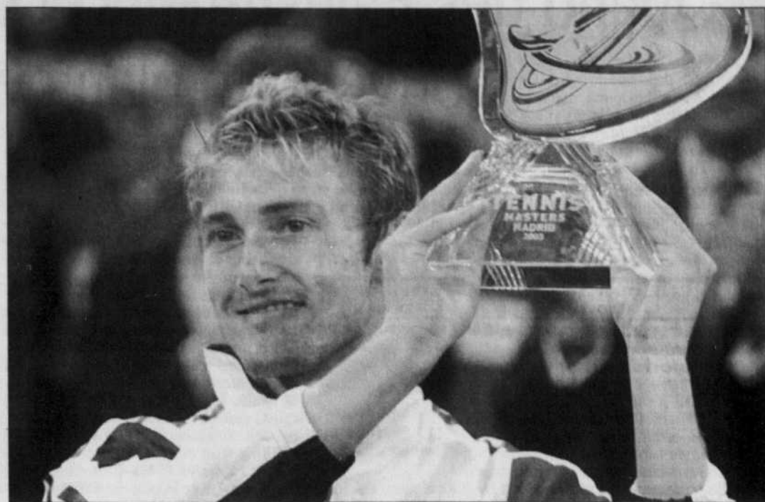
Juan Carlos Ferrero et son précieux trophée.

Même scénario dans la manche suivante: Ferrero prenait le premier service, sur un jeu blanc, du Chilien, pour mener 2-0 puis 3-1. Il n'arrivait pas ensuite