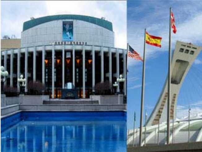
Place des arts de Montréal (à gauche) et le Stade Olympique

Il semble que la nouvelle salle de l'Orchestre symphonique de Montréal coûtera plus cher que l'avait annoncé le Premier ministre du Québec, Jean Charest. Au total, le complexe immobilier devait coûter 105 millions$ mais voilà qu'on vient de découvrir qu'il en coûterait plutôt 226 millions$. Cette salle sera située à proximité du Quartier des spectacles , un autre développement évalué à 120 millions$. Il est à souhaiter que ces projets ne deviennent pas un autre "Stade Olympique" , lequel devait coûter 486 millions$ mais dont la facture finale a dépassé 1,5 milliard$.