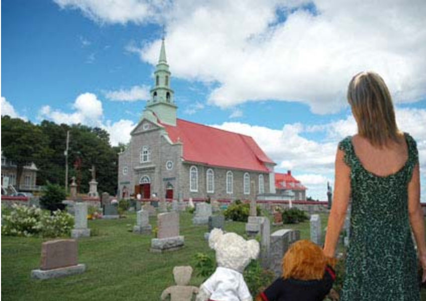
Mademoiselle X et les mascottes, Miss Gym, son frère Monsieur X et Goguis sur l'île d'Orléan en face de Québec.

"Ceux qui parlent ne savent pas. Ceux qui savent ne parlent pas! "