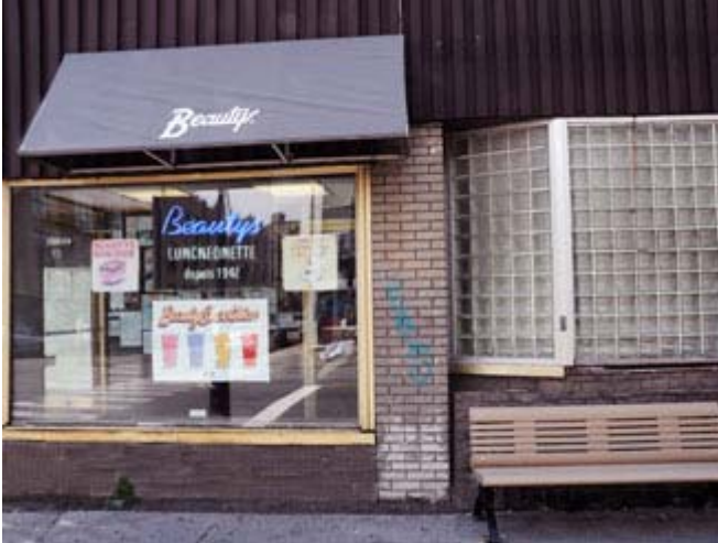
Restaurant Beauty's - Montréal