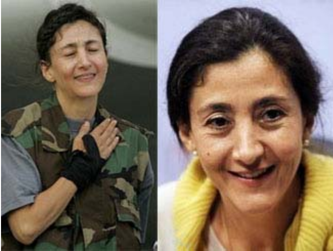
Ingrid Betancourt - Juillet 2008

Le destin d'Ingrid Betancourt est comme dans les séries américaines The Unit ou 24 Heures Chrono . Née dans une famille très confortable, elle a connu le bonheur de la vie aisée à Paris avant de se retrouver prisonnière pendant plus de six ans dans la jungle de Colombie. Après avoir survécu à ce martyre, voilà qu'elle est libérée par un commando spécial et qu'elle devient la femme la plus respectée de toute la planète. Il faudra surveiller la suite car la contribution qu'Ingrid apportera au monde risque de nous rejoindre tous, que l'on soit amateur de cinéma ou non! La rumeur circule de sa nomination au sein du Gouvernement de Nicolas Sarkozy. (Voir texte éditorial de l'éditeur)