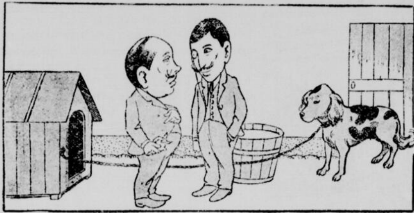
—Tiens, je vais lui lancer mon mouchoir.