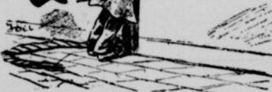
TERRIBLE DISTRACTION D'UN MOSSIEUR MY OPE