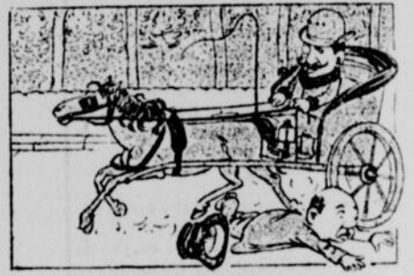
M. Courtvite.—Ces sales piétons ! on ne peut pas faire un pas sans en écraser un.