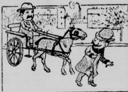
M. Marchapied.—Ces sales voitures ! on manque d'être écrasé à chaque minute.