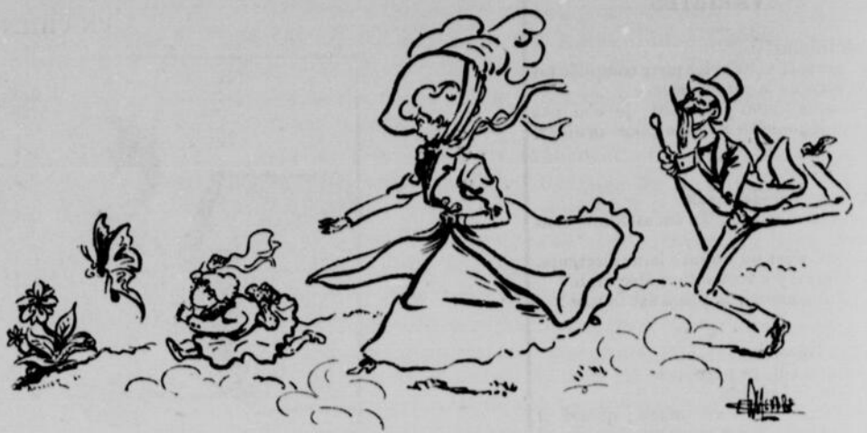
Dans la vie, on court toujours après quelque chose.