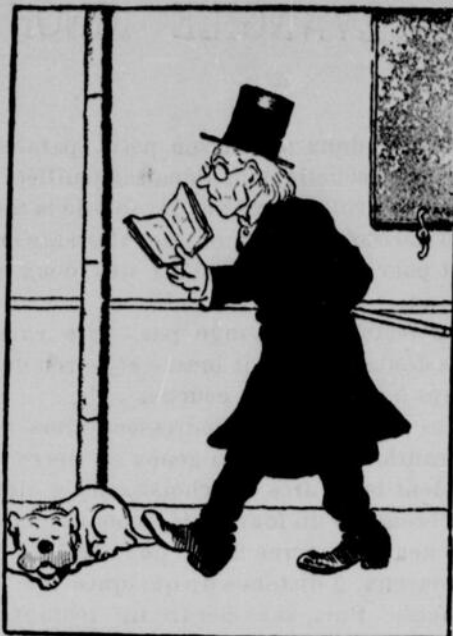
Le savant (qui repasse son Buffon avant le cours).—Le chien est...