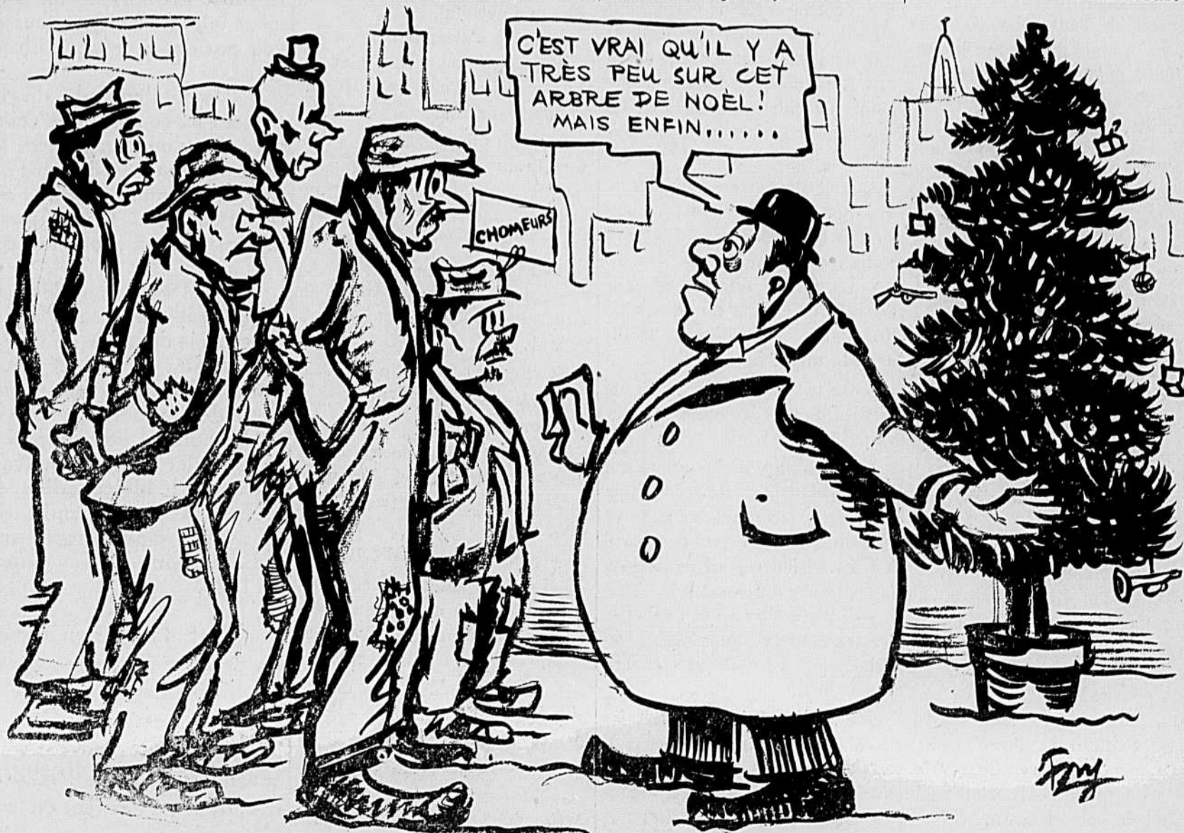
CAMILIEN . . . . . AVEC SON ARBRE DE NOËL SPÉCIALEMENT POUR LES CHOMEURS